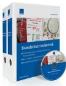
Brandschutz im Betrieb Ladenpreis: 207,90 EUR