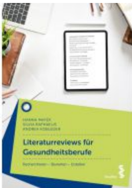
Literaturreviews für Gesundheitsberufe Ladenpreis: 26,90 EUR

Wir haben andere Produkte gefunden, die Ihnen gefallen könnten!