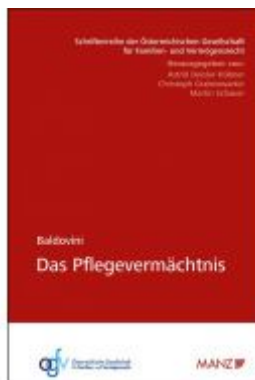
Das Pflegevermächtnis Ladenpreis: 39,80 EUR