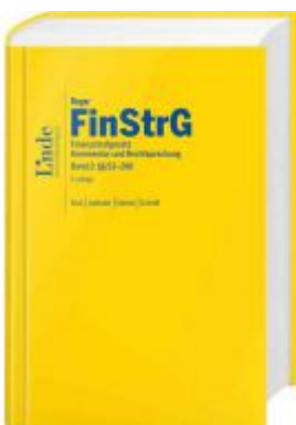
FinStrG | Finanzstrafgesetz Ladenpreis: 220,00 EUR