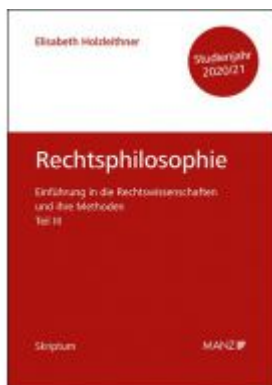
Rechtsphilosophie und Rechtsethik Einführung in die Rechtswissenschaften und ihre Methoden: Teil III Ladenpreis: 14,00 EUR