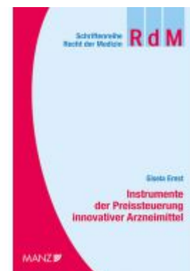
Instrumente der Preissteuerung innovativer Arzneimittel Ladenpreis: 54,00 EUR