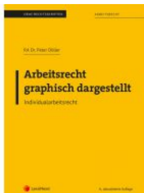
Arbeitsrecht graphisch dargestellt Ladenpreis: 21,00 EUR

Wir haben andere Produkte gefunden, die Ihnen gefallen könnten!