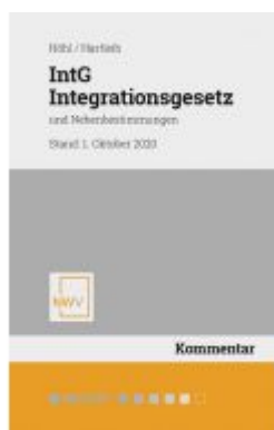
IntG Integrationsgesetz Ladenpreis: 68,00 EUR