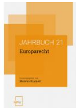
Europarecht Ladenpreis: 78,00 EUR