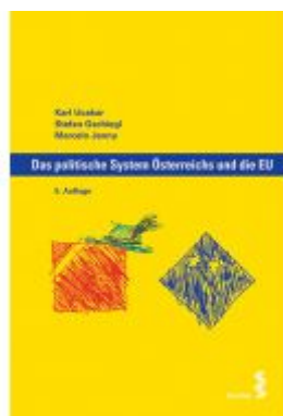
Das politische System Österreichs und die EU Ladenpreis: 16,90 EUR