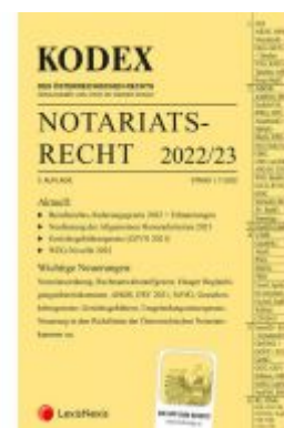
KODEX Notariatsrecht 2022/23 - inkl. App Ladenpreis: 45,00 EUR