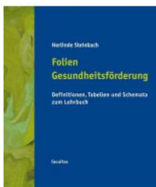
Folien Gesundheitsförderung Ladenpreis: 19,90 EUR