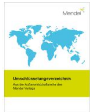
Umschlüsselungsverzeichnis Ladenpreis: 20,50EUR