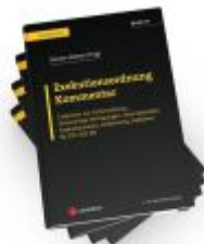
PAKET Exekutionsordnung Kommentar Ladenpreis: 612,00EUR