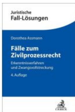
Fälle zum Zivilprozessrecht Ladenpreis: 25,60EUR