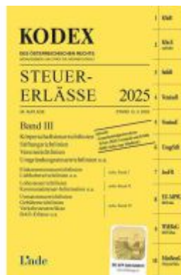
KODEX Steuer-Erlässe 2025, Band III Ladenpreis: 66,00EUR