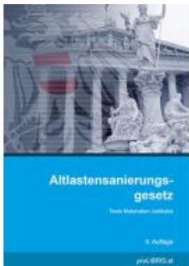
Altlastensanierungsgesetz Ladenpreis: 28,00EUR

Wir haben andere Produkte gefunden, die Ihnen gefallen könnten!