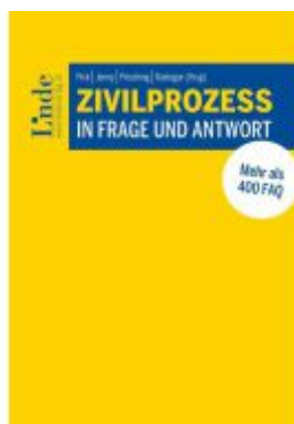
Zivilprozess in Frage und Antwort Ladenpreis: 59,00EUR