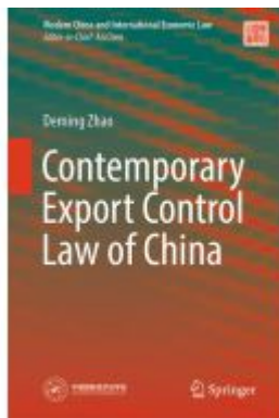
Contemporary Export Control Law of China Ladenpreis: 175,99EUR