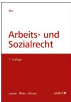
Arbeits- und Sozialrecht Ladenpreis: 65,00EUR