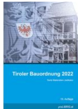
Tiroler Bauordnung 2022 Ladenpreis: 33,00EUR