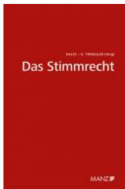
Das Stimmrecht Wiener Unternehmensrechtstag Ladenpreis: 44,00 EUR