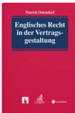
Englisches Recht in der Vertragsgestaltung Ladenpreis: 79,00 EUR