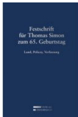
Festschrift für Thomas Simon zum 65. Geburtstag Ladenpreis: 109,00 EUR