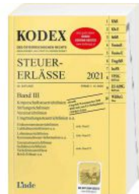
KODEX Steuer-Erlässe 2021 Band III Ladenpreis: 60,00 EUR