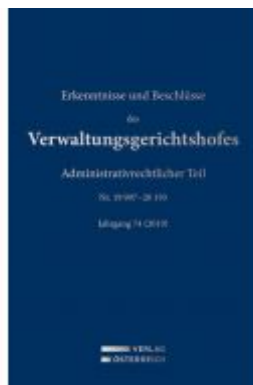
Erkenntnisse und Beschlüsse des Verwaltungsgerichtshofes Ladenpreis: 419,00 EUR