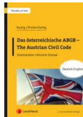
Das österreichische ABGB - The Austrian Civil Code Ladenpreis: 79,00 EUR