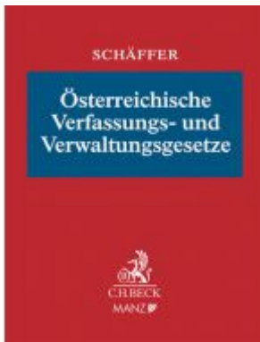
Österreichische Verfassungs- und Verwaltungsgesetze Ladenpreis: 199,00 EUR

Wir haben andere Produkte gefunden, die Ihnen gefallen könnten!