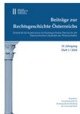
Beiträge zur Rechtsgeschichte Österreichs, 14. Jahrgang, Heft 1/2024 Ladenpreis: 69,00EUR