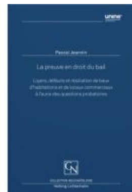
La preuve en droit du bail Ladenpreis: 129,00EUR