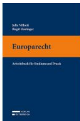
Europarecht Ladenpreis: 49,00EUR