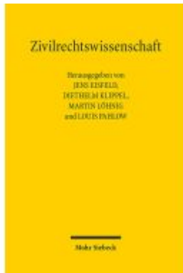
Zivilrechtswissenschaft Ladenpreis: 132,70EUR