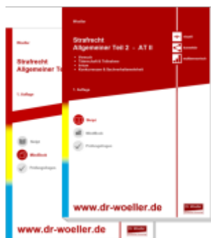
Paket Skript & MindBook - Strafrecht Allgemeiner Teil 2 – AT II Ladenpreis: 41,10EUR