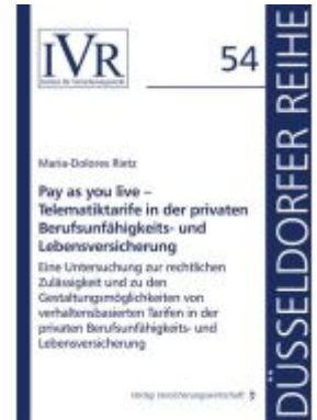
Pay as you live – Telematiktarife in der privaten Berufsunfähigkeits- und Lebensversicherung Ladenpreis: 61,50EUR