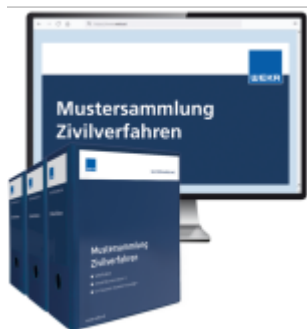
Mustersammlung Zivilverfahren Ladenpreis: 272,80EUR

Wir haben andere Produkte gefunden, die Ihnen gefallen könnten!