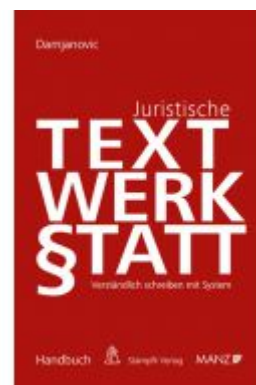
Juristische Textwerkstatt Verständlich Schreiben mit System Ladenpreis: 39,00 EUR