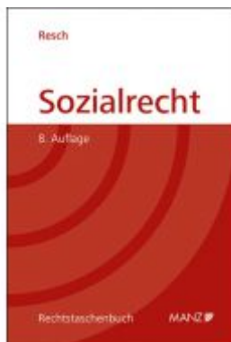
Sozialrecht Ladenpreis: 36,00 EUR