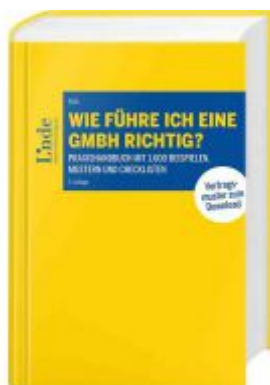
Wie führe ich eine GmbH richtig? Ladenpreis: 168,00 EUR