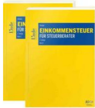
Einkommensteuer für Steuerberater Ladenpreis: 68,00 EUR