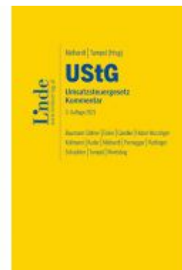
UStG | Umsatzsteuergesetz Ladenpreis: 330,00 EUR