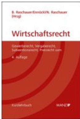
Grundriss des österreichischen Wirtschaftsrechts Ladenpreis: 98,00 EUR