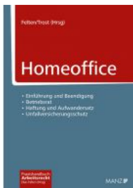
Homeoffice Ladenpreis: 79,00 EUR