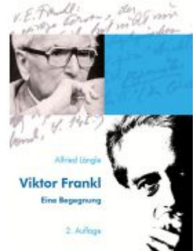
Viktor Frankl Ladenpreis: 19,90 EUR