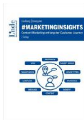
#marketinginsights Ladenpreis: 39,00EUR