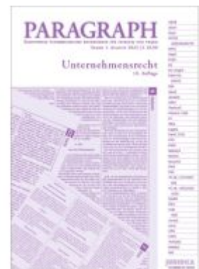
Paragraph - Unternehmensrecht Ladenpreis: 18,90EUR