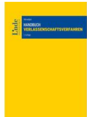
Handbuch Verlassenschaftsverfahren Ladenpreis: 95,00EUR