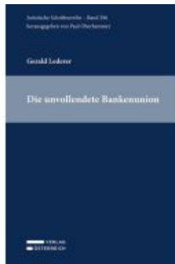
Die unvollendete Bankenunion Ladenpreis: 94,00EUR

Wir haben andere Produkte gefunden, die Ihnen gefallen könnten!