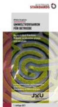
Umweltverfahren für Betriebe Ladenpreis: 27,50EUR