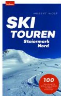
Skitouren Steiermark Nord Ladenpreis: 28,00EUR