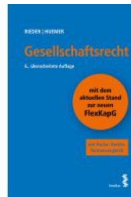
Gesellschaftsrecht Ladenpreis: 52,00EUR