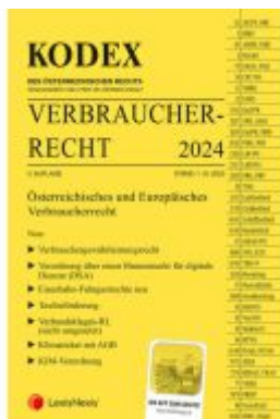
KODEX Verbraucherrecht 2024 Ladenpreis: 45,00EUR