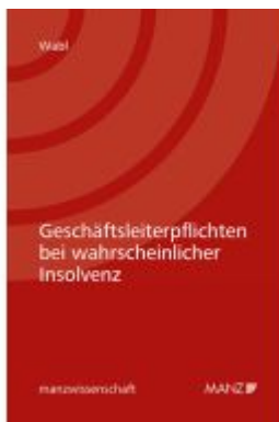
Geschäftsleiterpflichten bei wahrscheinlicher Insolvenz