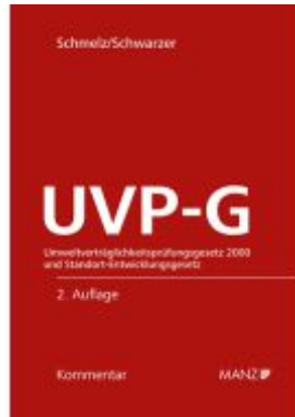
UVP-Gesetz Umweltverträglichkeitsprüfungsgesetz 2000 Aktionspreis: 278,00EUR Ladenpreis: 348,00EUR