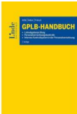
GPLB-Handbuch Ladenpreis: 66,00EUR