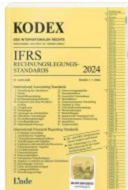
KODEX IFRS - Rechnungslegungsstandards 2024