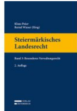
Steiermärkisches Landesrecht Ladenpreis: 99,00EUR