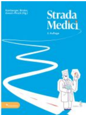
Strada Medici Ladenpreis: 38,00EUR