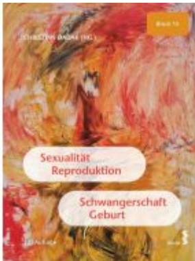
Sexualität, Reproduktion, Schwangerschaft, Geburt