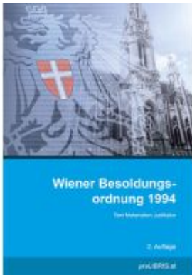
Wiener Besoldungsordnung 1994 Ladenpreis: 26,00EUR