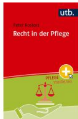
Recht in der Pflege Ladenpreis: 47,30EUR