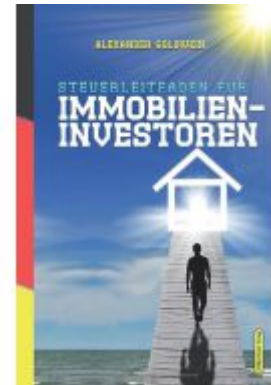
Steuerleitfaden für Immobilieninvestoren Ladenpreis: 34,90EUR