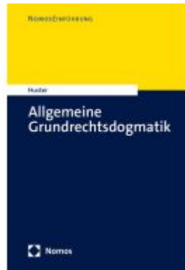
Allgemeine Grundrechtsdogmatik Ladenpreis: 27,70EUR