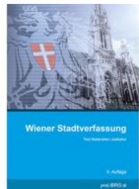
Wiener Stadtverfassung Ladenpreis: 26,00EUR