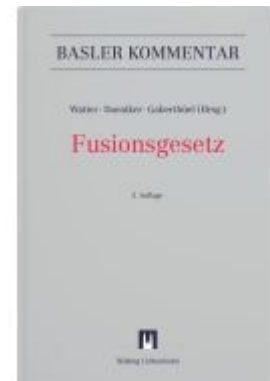
Fusionsgesetz (FusG) Ladenpreis: 405,00EUR