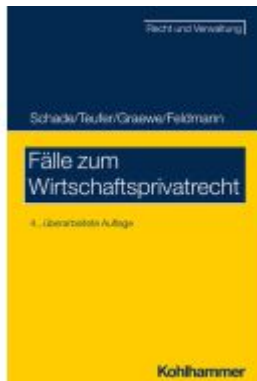
Fälle zum Wirtschaftsprivatrecht Ladenpreis: 26,70EUR