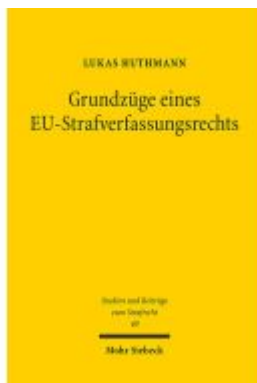
Grundzüge eines EU-Strafverfassungsrechts Ladenpreis: 86,40EUR