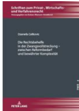
Die Rechtsbehelfe in der Zwangsvollstreckung – zwischen Reformbedarf und bewährter Komplexität Ladenpreis: 51,40EUR