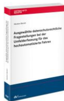
Ausgewählte datenschutzrechtliche Fragestellungen bei der Umfelderkennung für das hochautomatisierte Fahren Ladenpreis: 91,50EUR