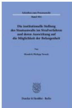
Die institutionelle Stellung des Staatsanwalts im Strafverfahren und deren Auswirkung auf die Möglichkeit der Befangenheit Ladenpreis: 71,90EUR