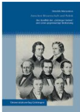
Zwischen Wissenschaft und Politik Ladenpreis: 21,60EUR