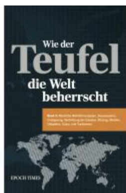
Wie der Teufel die Welt beherrscht (Band 2) Ladenpreis: 23,00EUR