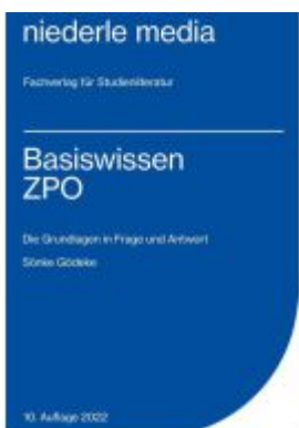
Basiswissen ZPO - 2022 Ladenpreis: 12,30EUR