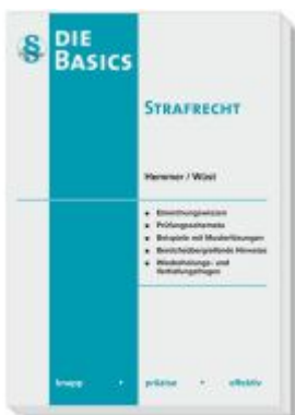
Basics Strafrecht Ladenpreis: 20,50EUR