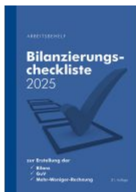
Bilanzierungscheckliste 2025 Ladenpreis: 17,00EUR