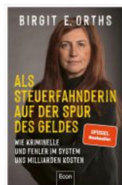
Als Steuerfahnderin auf der Spur des Geldes Ladenpreis: 20,60EUR