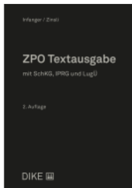
ZPO Textausgabe Ladenpreis: 64,00EUR