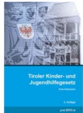
Tiroler Kinder- und Jugendhilfegesetz Ladenpreis: 23,00EUR