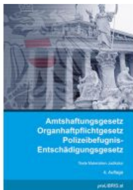
Amtshaftungsgesetz/Organhaftpflichtgesetz z/Polizeibefugnis-Entschädigungsgesetz Ladenpreis: 23,00EUR