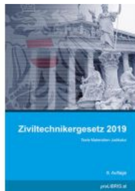
Ziviltechnikergesetz 2019 Ladenpreis: 26,00EUR