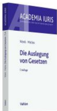
Die Auslegung von Gesetzen Ladenpreis: 19,50EUR