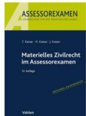
Materielles Zivilrecht im Assessorexamen Ladenpreis: 26,70EUR