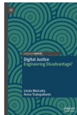
Digital Justice Ladenpreis: 43,99EUR