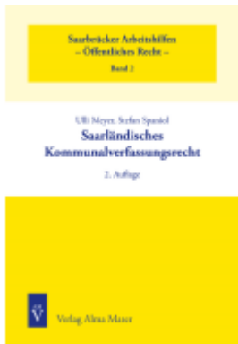
Saarländisches Kommunalverfassungsrecht Ladenpreis: 19,60EUR