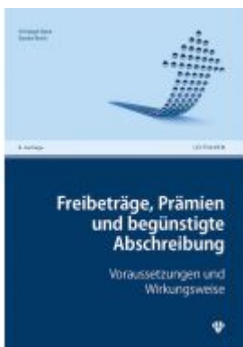
Freibeträge, Prämien und begünstigte Abschreibung Ladenpreis: 29,00EUR