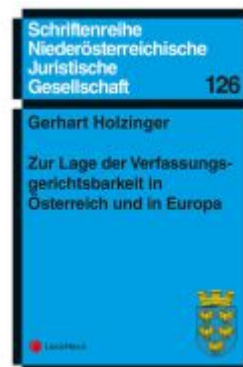
Zur Lage der Verfassungsgerichtsbarkeit in Österreich und in Europa Ladenpreis: 9,00EUR