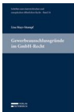
Gewerbeausschlussgründe im GmbH-Recht Ladenpreis: 84,00EUR