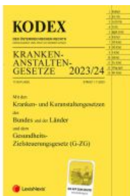
KODEX Krankenanstaltengesetze 2023/24 Ladenpreis: 74,00EUR