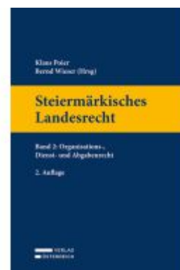
Steiermärkisches Landesrecht Ladenpreis: 99,00EUR