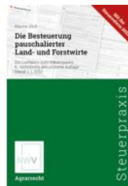
Die Besteuerung pauschalierter Land- und Forstwirte Ladenpreis: 128,00EUR