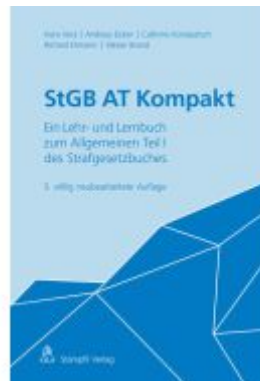
StGB AT Kompakt Ladenpreis: 98,40EUR