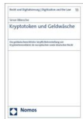
Kryptotoken und Geldwäsche Ladenpreis: 204,60EUR