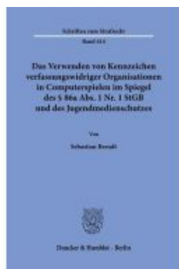
Das Verwenden von Kennzeichen verfassungswidriger Organisationen in Computerspielen im Spiegel des § 86a Abs. 1 Nr. 1 StGB und des Jugendmedienschutzgesetzes. Ladenpreis: 102,70EUR