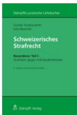
Schweizerisches Strafrecht, Besonderer Teil I: Straftaten gegen Individualinteressen Ladenpreis: 129,40EUR