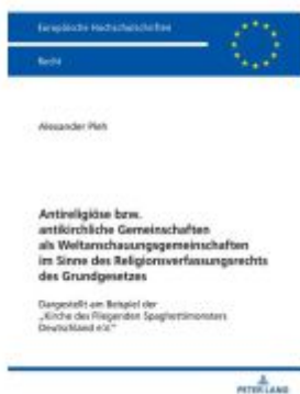
Antireligiöse bzw. antikirchliche Gemeinschaften als Weltanschauungsgemeinschaften im Sinne des Religionsverfassungsrechts des Grundgesetzes Ladenpreis: 51,40EUR