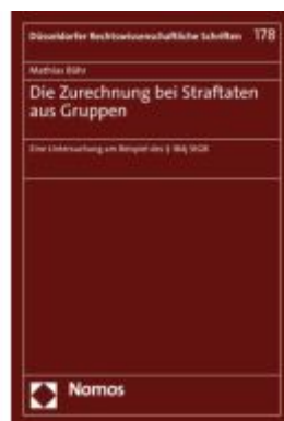
Die Zurechnung bei Straftaten aus Gruppen Ladenpreis: 86,40EUR