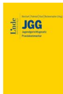
JGG | Jugendgerichtsgesetz Ladenpreis: 77,00EUR