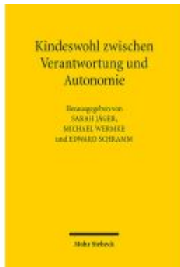
Kindeswohl zwischen Verantwortung und Autonomie Ladenpreis: 60,70EUR