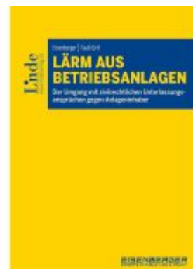
Lärm aus Betriebsanlagen Ladenpreis: 39,00EUR