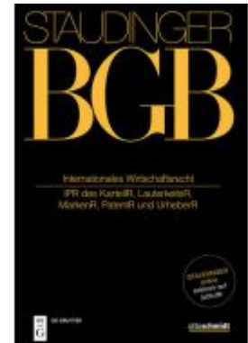
J. von Staudingers Kommentar zum Bürgerlichen Gesetzbuch mit Einführungsgesetz... / Internationales Wirtschaftsrecht Ladenpreis: 239,00EUR