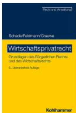
Wirtschaftsprivatrecht Ladenpreis: 32,90EUR