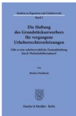
Die Haftung des Grundstückserwerbers für vergangene Urheberrechtsverletzungen. Ladenpreis: 82,20EUR