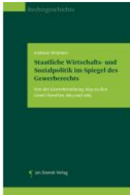
Staatliche Wirtschafts- und Sozialpolitik im Spiegel des Gewerberechts Ladenpreis: 49,90EUR

Wir haben andere Produkte gefunden, die Ihnen gefallen könnten!