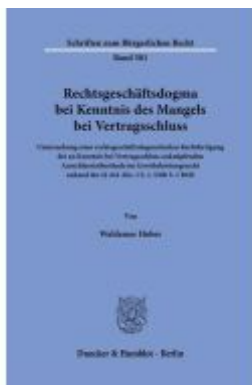
Rechtsgeschäftsdogma bei Kenntnis des Mangels bei Vertragsschluss Ladenpreis: 92,50EUR