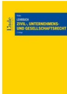
Lehrbuch Zivil-, Unternehmens- und Gesellschaftsrecht Ladenpreis: 56,00EUR