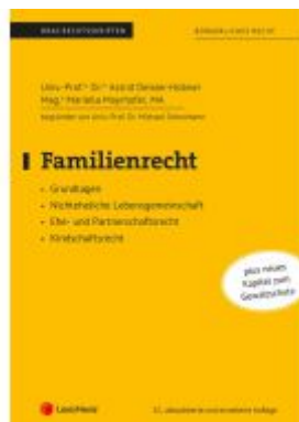
Familienrecht (Skriptum) Ladenpreis: 27,50EUR