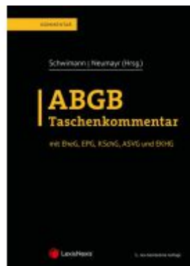
ABGB Taschenkommentar Aktionspreis: 249,00 EUR Ladenpreis: 319,00 EUR