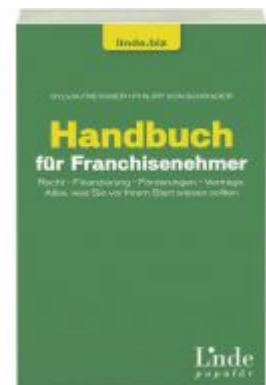
Handbuch für Franchisenehmer Ladenpreis: 19,90 EUR