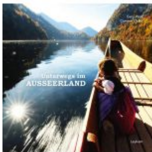
Unterwegs im Ausseerland Ladenpreis: 19,90 EUR