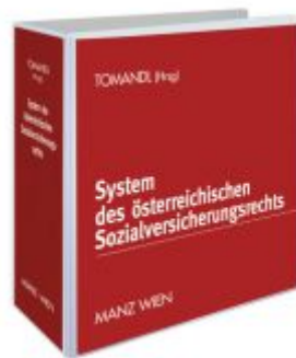
System des österreichischen Sozialversicherungsrechts Ladenpreis: 258,00 EUR