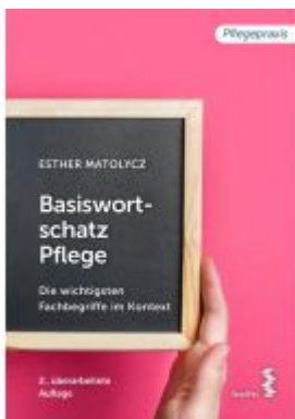
Basiswortschatz Pflege Ladenpreis: 18,90 EUR