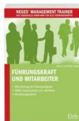
Führungskraft und Mitarbeiter Ladenpreis: 15,40 EUR