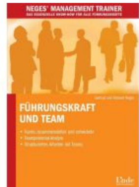
Führungskraft und Team Ladenpreis: 15,40 EUR