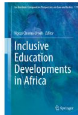
Inclusive Education Developments in Africa