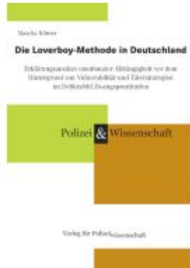
Die Loverboy-Methode in Deutschland Ladenpreis: 29,80EUR