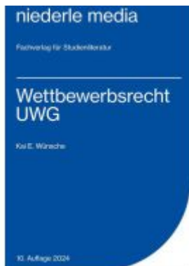
Wettbewerbsrecht - UWG - 2024