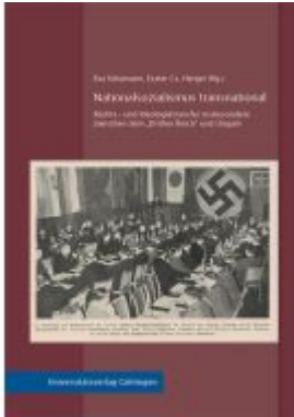
Nationalsozialismus transnational Ladenpreis: 50,40EUR