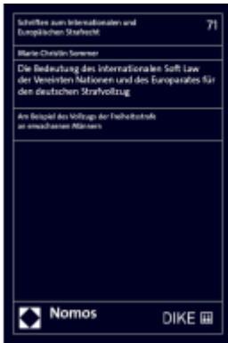
Die Bedeutung des internationalen Soft Law der Vereinten Nationen und des Europarates für den deutschen Strafvollzug Ladenpreis: 149,00EUR