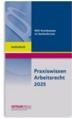
Praxiswissen Arbeitsrecht 2025 katholisch Ladenpreis: 13,30EUR