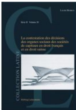
La contestation des décisions des organes sociaux dans les sociétés de capitaux en droit français et en droit suisse