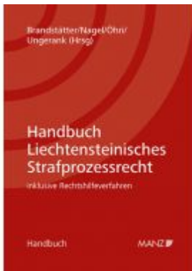
Handbuch Liechtensteinisches Strafprozessrecht Ladenpreis: 224,00 EUR

Wir haben andere Produkte gefunden, die Ihnen gefallen könnten!