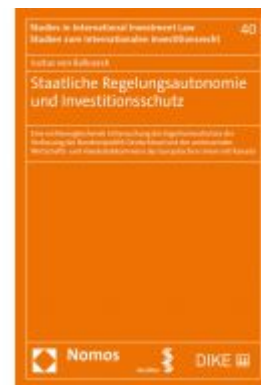
Staatliche Regelungsautonomie und Investitionsschutz Ladenpreis: 63,80 EUR