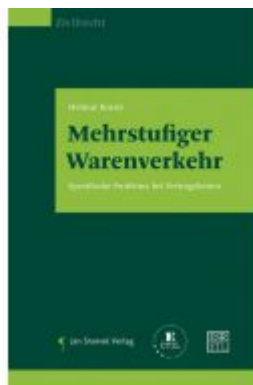
Mehrstufiger Warenverkehr Ladenpreis: 68,00 EUR