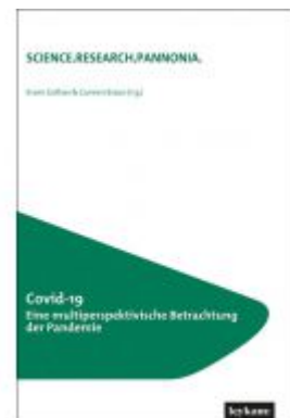
Covid-19 Eine multiperspektivische Betrachtung der Pandemie Ladenpreis: 35,00 EUR