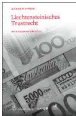
Liechtensteinisches Trustrecht Ladenpreis: 99,00 EUR