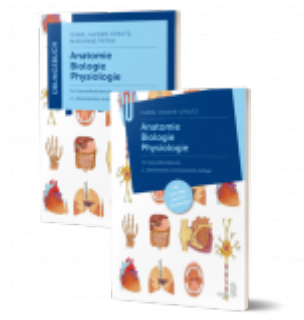
Lernpaket Anatomie – Biologie – Physiologie Ladenpreis: 54,90 EUR