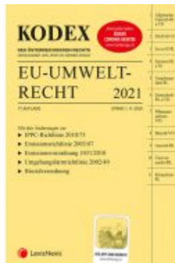
KODEX EU-Umweltrecht 2021 Ladenpreis: 103,00 EUR