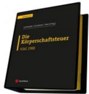
Die Körperschaftsteuer (KStG 1988) Ladenpreis: 410,00 EUR