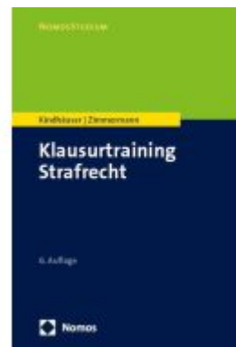
Klausurtraining Strafrecht Ladenpreis: 27,70EUR