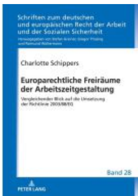
Europarechtliche Freiräume der Arbeitszeitgestaltung Ladenpreis: 82,20EUR