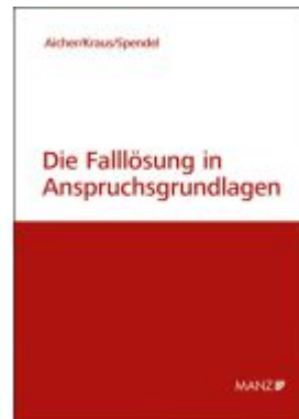
Die Falllösung nach Anspruchsgrundlagen Ladenpreis: 18,00EUR