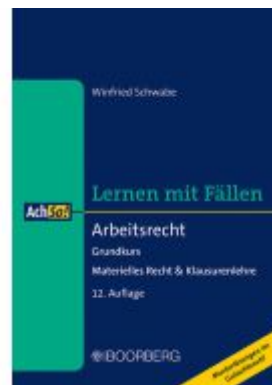
Arbeitsrecht Ladenpreis: 20,40EUR