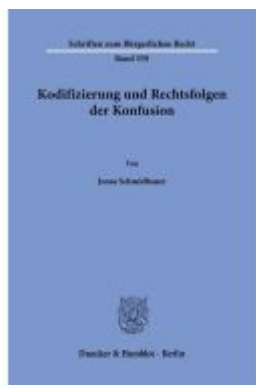
Kodifizierung und Rechtsfolgen der Konfusion. Ladenpreis: 71,90EUR