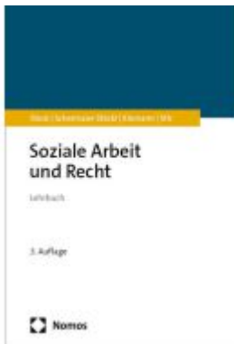
Soziale Arbeit und Recht Ladenpreis: 45,30EUR