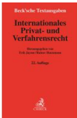
Internationales Privat- und Verfahrensrecht Ladenpreis: 30,80EUR