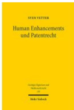
Human Enhancements und Patentrecht Ladenpreis: 132,70EUR