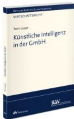
Künstliche Intelligenz in der GmbH Ladenpreis: 91,50EUR