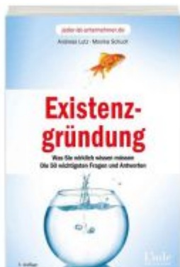
Existenzgründung Ladenpreis: 19,90 EUR

Wir haben andere Produkte gefunden, die Ihnen gefallen könnten!