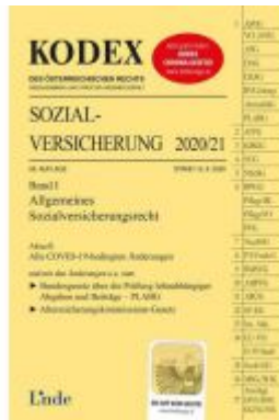
KODEX Sozialversicherung 2020/21, Band I Ladenpreis: 41,00 EUR