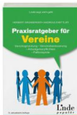
Praxisratgeber für Vereine Ladenpreis: 24,90 EUR