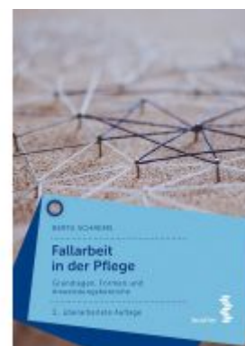
Fallarbeit in der Pflege Ladenpreis: 19,90 EUR