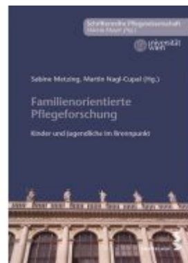
Familienorientierte Pflegeforschung Ladenpreis: 9,90 EUR