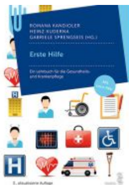
Erste Hilfe Ladenpreis: 24,90 EUR