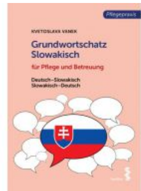
Grundwortschatz Slowakisch für Pflege- und Gesundheitsberufe Ladenpreis: 18,90 EUR