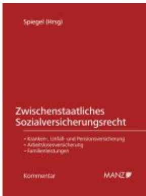
Zwischenstaatliches Sozialversicherungsrecht Ladenpreis: 198,00 EUR