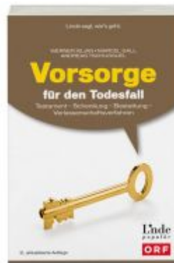
Vorsorge für den Todesfall Ladenpreis: 19,90 EUR