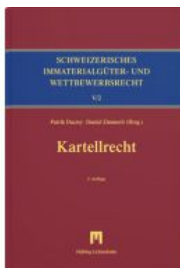
Kartellrecht Ladenpreis: 405,00EUR