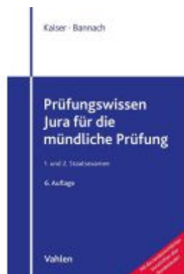
Prüfungswissen Jura für die mündliche Prüfung Ladenpreis: 20,40EUR