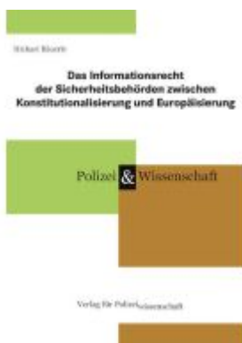
Das Informationsrecht der Sicherheitsbehörden zwischen Konstitutionalisierung und Europäisierung Ladenpreis: 23,60EUR