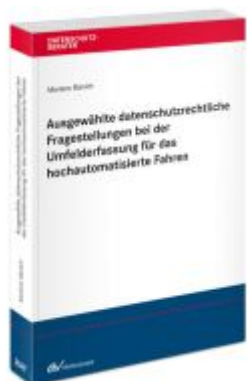
Ausgewählte datenschutzrechtliche Fragestellungen bei der Umfelderkennung für das hochautomatisierte Fahren Ladenpreis: 91,50EUR