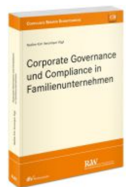
Corporate Governance und Compliance in Familienunternehmen Ladenpreis: 91,50EUR