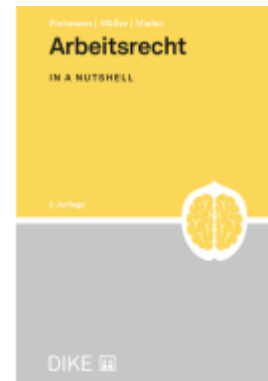
Arbeitsrecht Ladenpreis: 64,00EUR