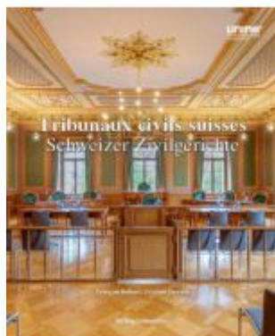
Tribunaux civils suisses - Schweizer Zivilgerichte Ladenpreis: 141,00EUR