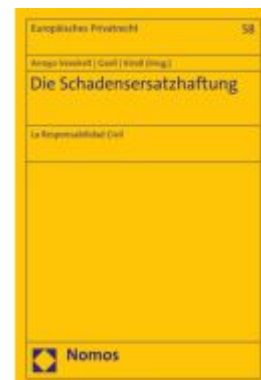
Die Schadensersatzhaftung Ladenpreis: 81,30EUR