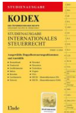
KODEX Studienausgabe Internationales Steuerrecht Ladenpreis: 20,00EUR