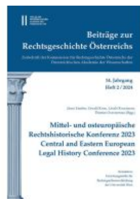
Beiträge zur Rechtsgeschichte Österreichs, 14. Jahrgang, Heft 2/2024 Ladenpreis: 69,00EUR