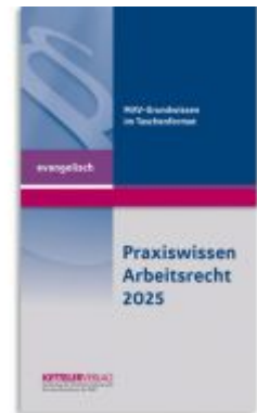
Praxiswissen Arbeitsrecht 2025 evangelisch Ladenpreis: 13,30EUR