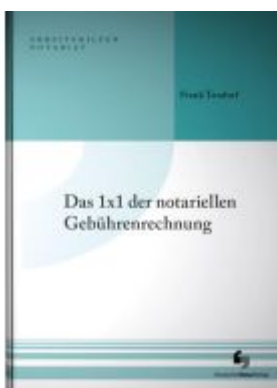
Das 1x1 der notariellen Gebührenrechnung Ladenpreis: 40,10EUR