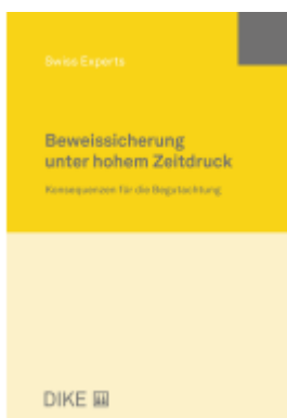
Beweissicherung unter hohem Zeitdruck Ladenpreis: 58,00EUR