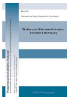
Studien zum Schusswaffeneinsatz: Schießen & Bewegung Ladenpreis: 29,80EUR