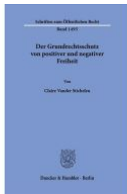
Der Grundrechtsschutz von positiver und negativer Freiheit. Ladenpreis: 102,70EUR