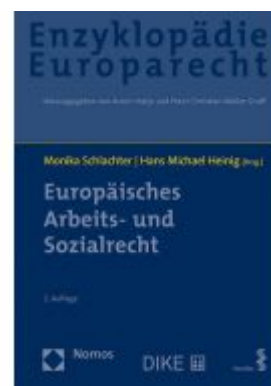
Europäisches Arbeits- und Sozialrecht Ladenpreis: 193,30 EUR