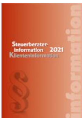
Steuerberaterinformation 2021 Ladenpreis: 44,90 EUR