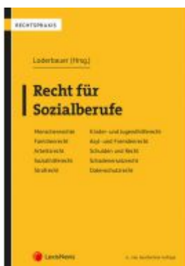
Recht für Sozialberufe Ladenpreis: 62,00 EUR