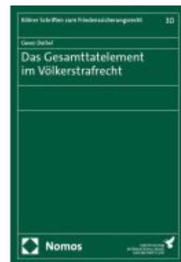
Das Gesamttatelement im Völkerstrafrecht Ladenpreis: 112,10EUR