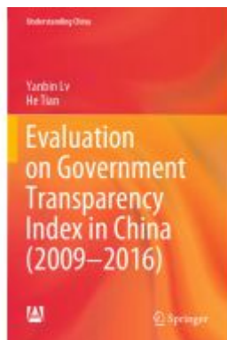
Evaluation on Government Transparency Index in China (2009—2016) Ladenpreis: 109,99EUR

Wir haben andere Produkte gefunden, die Ihnen gefallen könnten!