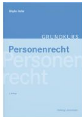
Grundkurs Personenrecht Ladenpreis: 53,00EUR