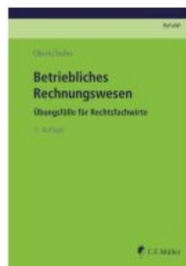
Betriebliches Rechnungswesen Ladenpreis: 30,90EUR