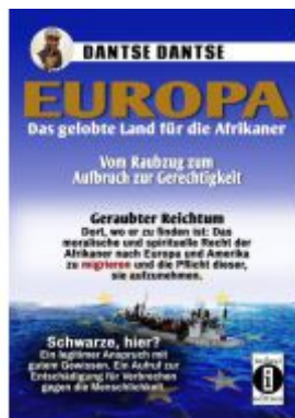
Europa: Das gelobte Land für afrikanische Menschen - vom Raubzug zum Aufbruch zu Gerechtigkeit Ladenpreis: 25,70EUR