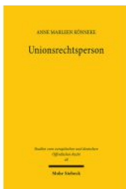
Unionsrechtsperson Ladenpreis: 96,70EUR