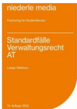
Standardfälle Verwaltungsrecht AT - 2022 Ladenpreis: 13,30EUR