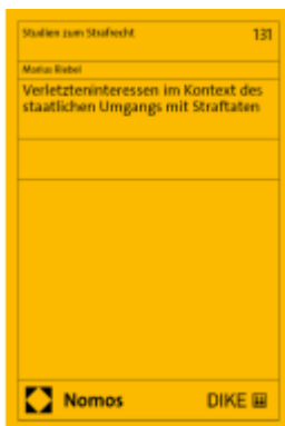
Verletzteninteressen im Kontext des staatlichen Umgangs mit Straftaten Ladenpreis: 159,00EUR