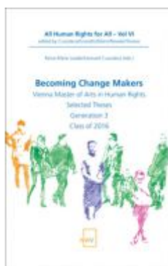
Becoming Change Makers Ladenpreis: 58,00 EUR