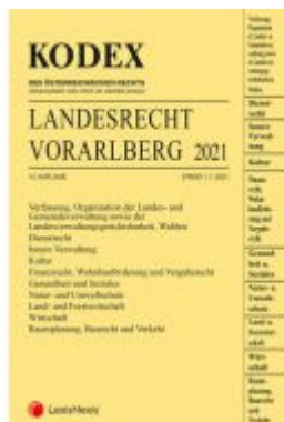
KODEX Landesrecht Vorarlberg 2021 Ladenpreis: 115,00 EUR