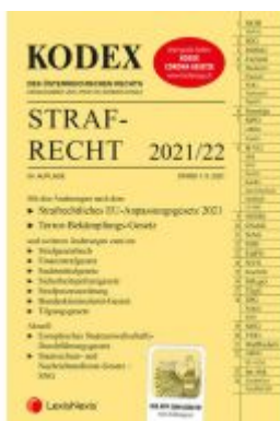
KODEX Strafrecht 2021/22 - inkl. App Ladenpreis: 36,00 EUR