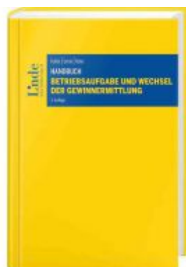
Handbuch Betriebsaufgabe und Wechsel der Gewinnermittlung Ladenpreis: 64,00 EUR