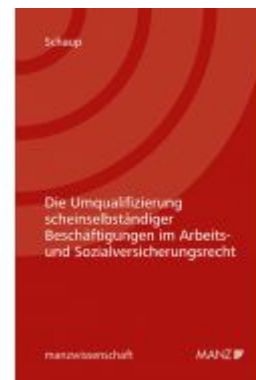
Die Umqualifizierung scheinselbständiger Beschäftigungen im Arbeits- und Sozialversicherungsrecht Ladenpreis: 56,00 EUR