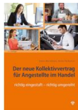
Der neue Kollektivvertrag für Angestellte im Handel Ladenpreis: 36,75 EUR