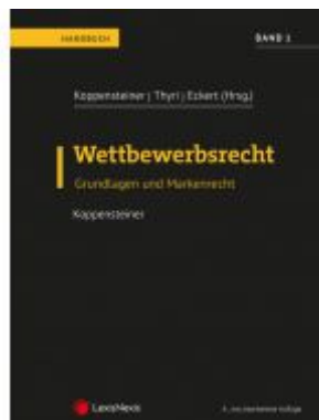
Wettbewerbsrecht - Band 1 Ladenpreis: 129,00 EUR