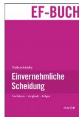
Einvernehmliche Scheidung Ladenpreis: 69,00 EUR