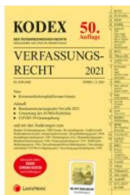
KODEX Verfassungsrecht 2021 Ladenpreis: 40,00 EUR