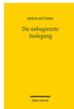
Die unbegrenzte Auslegung Ladenpreis: 29,90EUR