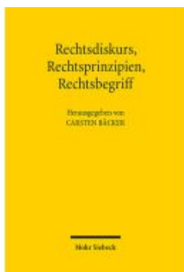
Rechtsdiskurs, Rechtsprinzipien, Rechtsbegriff Ladenpreis: 112,10EUR