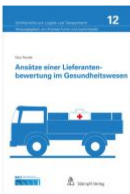
Ansätze einer Lieferantenbewertung im Gesundheitswesen Ladenpreis: 81,20EUR