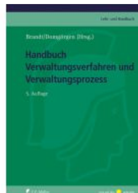
Handbuch Verwaltungsverfahren und Verwaltungsprozess Ladenpreis: 226,20EUR