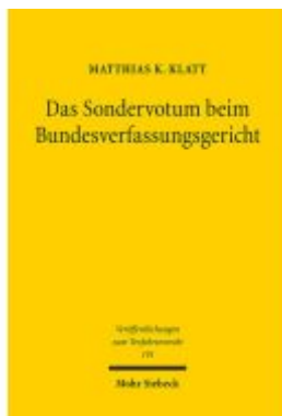
Das Sondervotum beim Bundesverfassungsgericht Ladenpreis: 81,30EUR