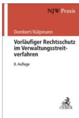
Vorläufiger Rechtsschutz im Verwaltungsstreitverfahren Ladenpreis: 132,70EUR