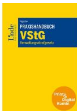
Praxishandbuch VStG | Verwaltungsstrafgesetz (Kombi Print&digital) Ladenpreis: 79,00EUR