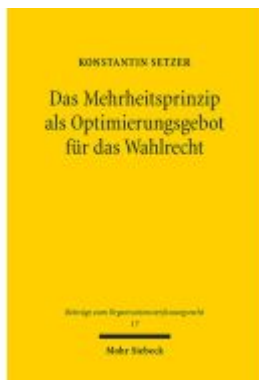
Das Mehrheitsprinzip als Optimierungsgebot für das Wahlrecht Ladenpreis: 122,40EUR