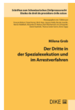
Der Dritte in der Spezialexécution und im Arrestverfahren Ladenpreis: 108,00EUR