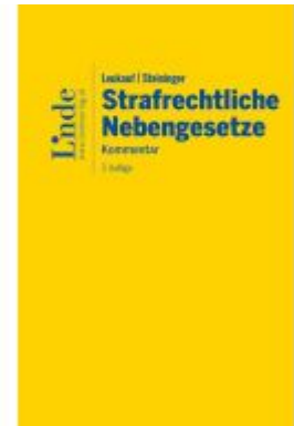
Leukauf/Steininger Strafrechtliche Nebengesetze Ladenpreis: 198,00EUR