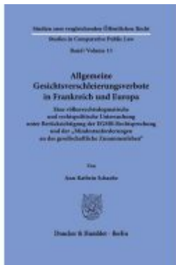
Allgemeine Gesichtsverschleiervverbote in Frankreich und Europa. Ladenpreis: 102,70EUR