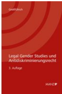
Legal Gender Studies und Antidiskriminierungsrecht Ladenpreis: 52,00EUR