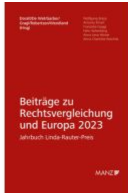
Beiträge zur Rechtsvergleichung und Europa 2023 Jahrbuch Linda-Rauter-Preis Ladenpreis: 94,00EUR