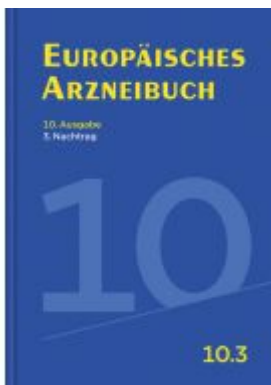
Europäisches Arzneibuch Ladenpreis: 57,20 EUR