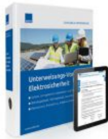
Unterweisungs-Vorlagen Elektrosicherheit Ladenpreis: 217,80 EUR