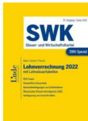
SWK-Spezial Lohnverrechnung 2022 Ladenpreis: 48,00 EUR