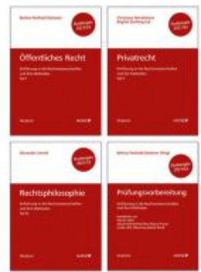
PAKET: Prüfungsvorbereitung + Einführung in die Rechtswissenschaften und ihre Methoden: Tl. I + Tl. II + Tl. III Ladenpreis: 44,00 EUR