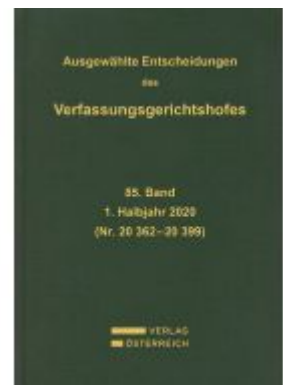
Ausgewählte Entscheidungen des Verfassungsgerichtshofes Ladenpreis: 259,00 EUR