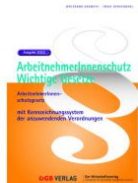
ArbeitnehmerInnenschutz. Ladenpreis: 46,00 EUR