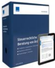
Steuerrechtliche Beratung von Ärzten Ladenpreis: 239,80 EUR