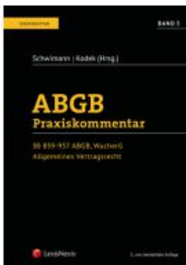
ABGB Praxiskommentar / ABGB Praxiskommentar - Band 5, 5. Auflage Ladenpreis: 289,00 EUR