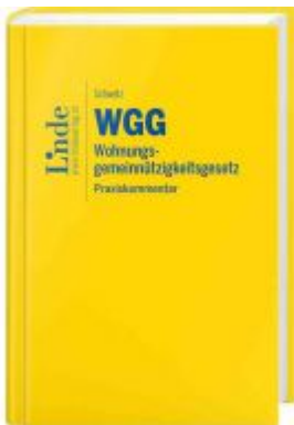
WGG | Wohnungsgemeinnützigkeitsgesetz Ladenpreis: 79,00 EUR

Wir haben andere Produkte gefunden, die Ihnen gefallen könnten!