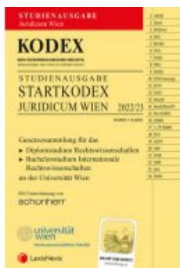
KODEX Startkodex Wien Juridicum 2022/23 - inkl. App Ladenpreis: 19,00EUR