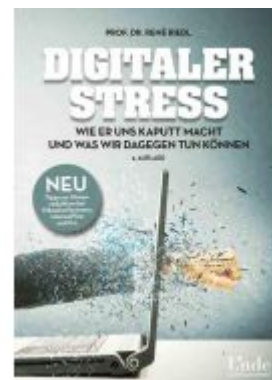
Digitaler Stress Ladenpreis: 22,00EUR