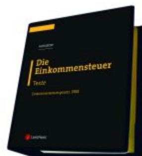
Die Einkommensteuer (EStG 1988) Band I - Texte Ladenpreis: 298,00EUR