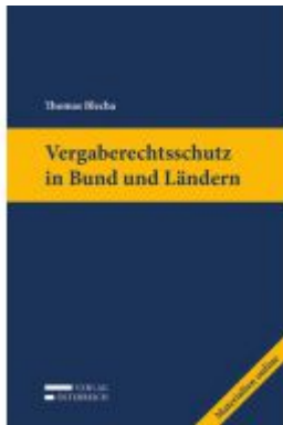
Vergaberechtsschutz in Bund und Ländern Ladenpreis: 199,00EUR