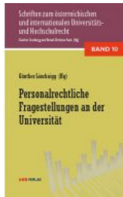
Personalrechtliche Fragestellungen an der Universität Ladenpreis: 36,00EUR