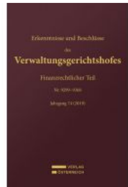
Erkenntnisse und Beschlüsse des Verwaltungsgerichtshofes Ladenpreis: 189,00EUR