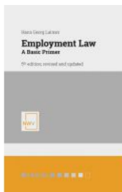
Employment Law Ladenpreis: 38,00EUR