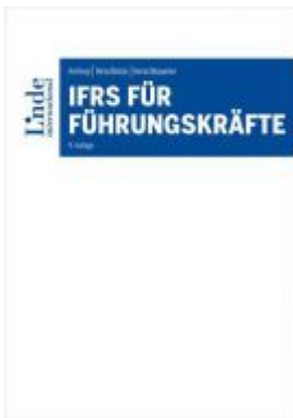
IFRS für Führungskräfte Ladenpreis: 54,00EUR