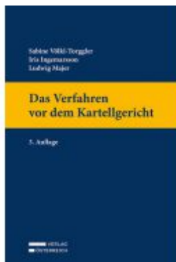
Das Verfahren vor dem Kartellgericht Ladenpreis: 119,00EUR