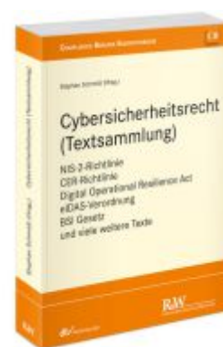
Cybersicherheitsrecht (Textsammlung) Ladenpreis: 40,10EUR