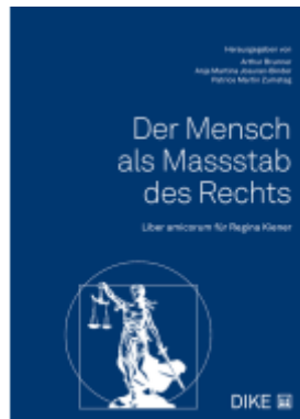
Der Mensch als Masstab des Rechts Ladenpreis: 132,00EUR