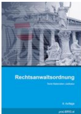
Rechtsanwaltsordnung Ladenpreis: 36,00EUR

Wir haben andere Produkte gefunden, die Ihnen gefallen könnten!