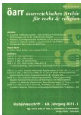
Österreichisches Archiv für Recht und Religion Ladenpreis: 35,00EUR