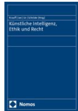
Künstliche Intelligenz, Ethik und Recht Ladenpreis: 50,40EUR