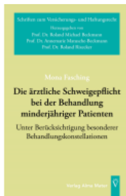
Die ärztliche Schweigepflicht bei der Behandlung minderjähriger Patienten Ladenpreis: 80,20EUR