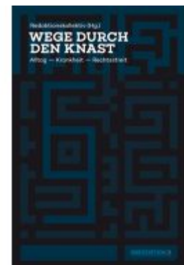
Wege durch den Knast Ladenpreis: 20,50EUR