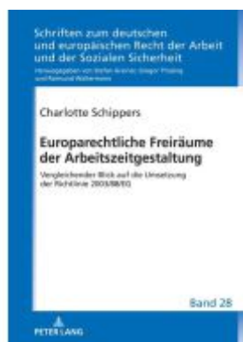
Europarechtliche Freiräume der Arbeitszeitgestaltung Ladenpreis: 82,20EUR