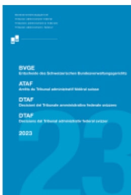
BVGE Jahresband 2023 Ladenpreis: 104,00EUR