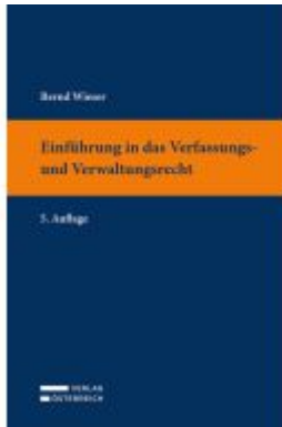
Einführung in das Verfassungs- und Verwaltungsrecht Ladenpreis: 39,00EUR