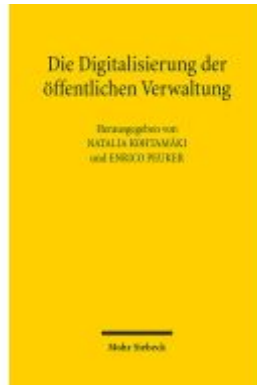
Die Digitalisierung der öffentlichen Verwaltung Ladenpreis: 91,50EUR