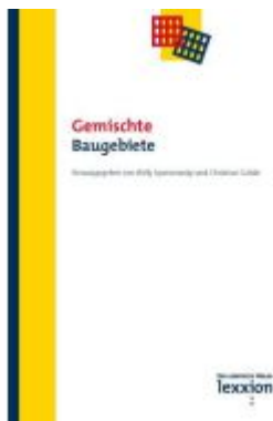
Gemischte Baugebiete Ladenpreis: 39,10EUR