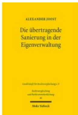
Die übertragende Sanierung in der Eigenverwaltung Ladenpreis: 86,40EUR