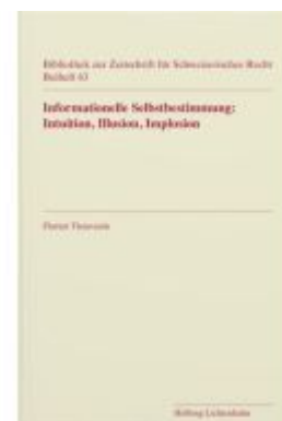
Informationelle Selbstbestimmung: Intuition, Illusion, Implosion Ladenpreis: 42,00EUR