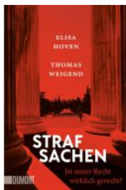
Strafsachen Ladenpreis: 14,40EUR