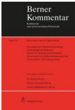
Materialien zum Zivilgesetzbuch Band IV Ladenpreis: 410,30EUR