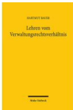
Lehren vom Verwaltungsrechtsverhältnis Ladenpreis: 81,30EUR