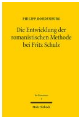
Die Entwicklung der romanistischen Methode bei Fritz Schulz Ladenpreis: 82,30EUR