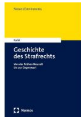
Geschichte des Strafrechts Ladenpreis: 30,80EUR