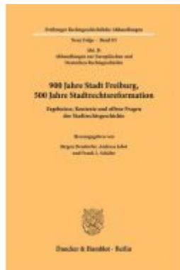
900 Jahre Stadt Freiburg, 500 Jahre Stadtrechtsreform. Ladenpreis: 92,50EUR