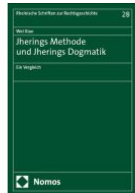
Jherings Methode und Jherings Dogmatik Ladenpreis: 184,10EUR