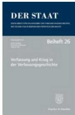
Verfassung und Krieg in der Verfassungsgeschichte. Ladenpreis: 61,60EUR