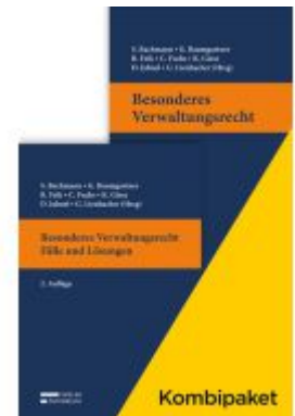
Kombipaket Besonderes Verwaltungsrecht: Lehrbuch & Fälle und Lösungen Ladenpreis: 78,00EUR