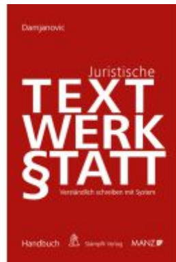
Juristische Textwerkstatt Verständlich Schreiben mit System Ladenpreis: 39,00EUR