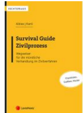
Survival Guide Zivilprozess Ladenpreis: 19,00EUR