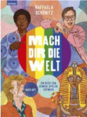
Mach dir die Welt 2 Ladenpreis: 26,50EUR

Wir haben andere Produkte gefunden, die Ihnen gefallen könnten!