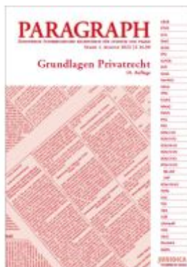
Paragraph - Grundlagen Privatrecht Ladenpreis: 16,90EUR