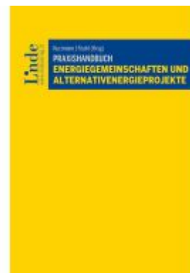
Praxishandbuch Energiegemeinschaften und Alternativenenergieprojekte Ladenpreis: 88,00EUR