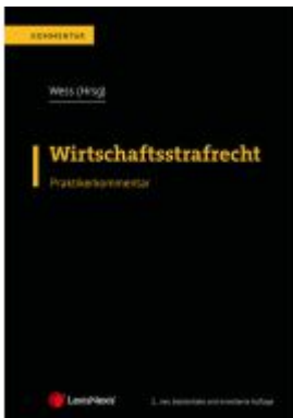
Wirtschaftsstrafrecht Ladenpreis: 329,00EUR