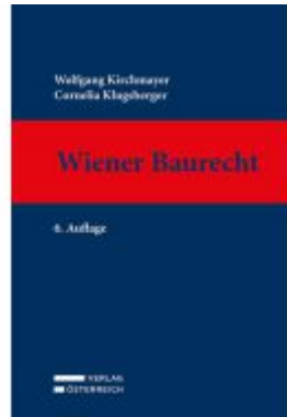
Wiener Baurecht Ladenpreis: 169,00EUR