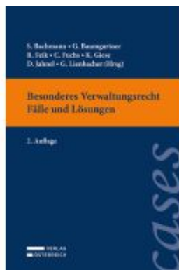
Besonderes Verwaltungsrecht - Fälle und Lösungen Ladenpreis: 33,00EUR