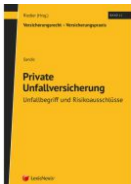
Private Unfallversicherung - Unfallbegriff und Risikoausschlüsse Ladenpreis: 74,00EUR