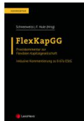
FlexKapGG Ladenpreis: 95,00EUR