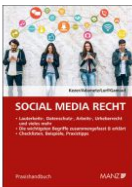
Social Media Recht Ladenpreis: 42,00EUR