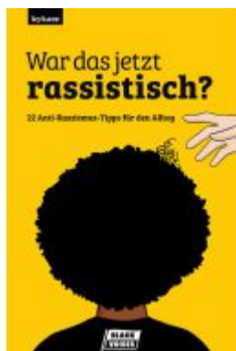
War das jetzt rassistisch?