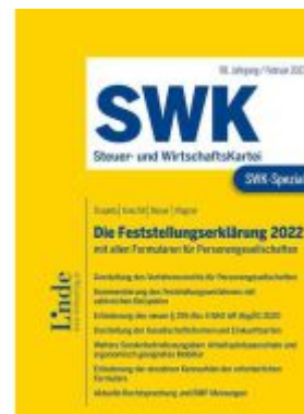
SWK-Spezial Die Feststellungserklärung 2022 Ladenpreis: 49,00EUR