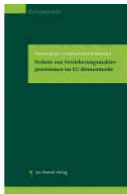
Verbote von Versicherungsmaklerprovisionen im EU- Binnenmarkt