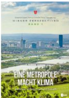
Eine Metropole macht Klima