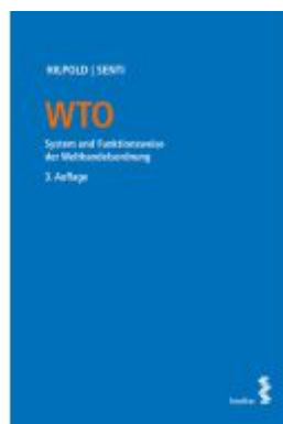
WTO Ladenpreis: 86,00EUR