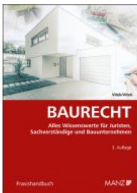
Baurecht Ladenpreis: 48,00EUR

Wir haben andere Produkte gefunden, die Ihnen gefallen könnten!