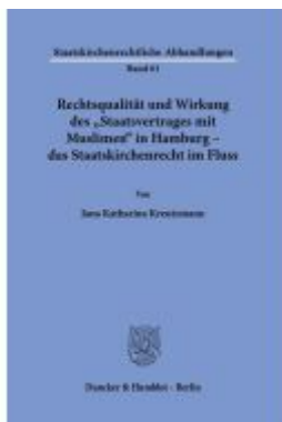
Rechtsqualität und Wirkung des "Staatsvertrages mit Muslimen" in Hamburg – das Staatskirchenrecht im Fluss. Ladenpreis: 92,50EUR