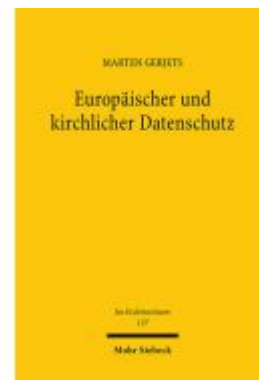
Europäischer und kirchlicher Datenschutz Ladenpreis: 112,10EUR