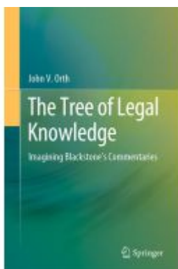
The Tree of Legal Knowledge Ladenpreis: 164,99EUR