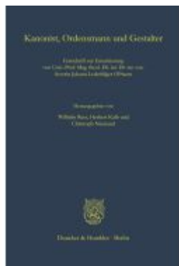
Kanonist, Ordensmann und Gestalter. Ladenpreis: 133,60EUR