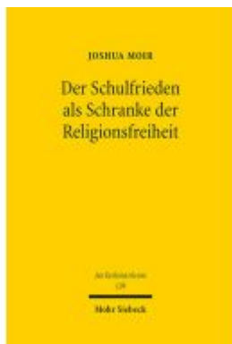
Der Schulfrieden als Schranke der Religionsfreiheit Ladenpreis: 101,80EUR