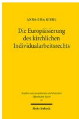
Die Europäisierung des kirchlichen Individualarbeitsrechts Ladenpreis: 86,40EUR