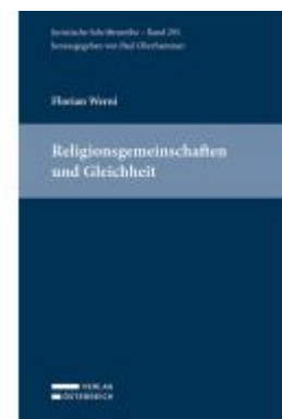
Religionsgemeinschaften und Gleichheit Ladenpreis: 145,00EUR