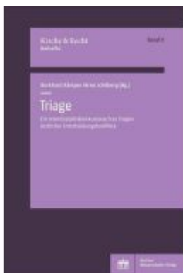
Triage Ladenpreis: 37,10EUR