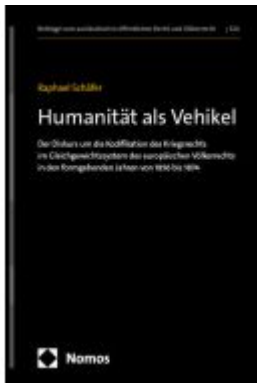
Humanität als Vehikel Ladenpreis: 286,90EUR