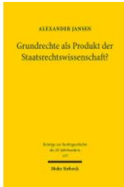
Grundrechte als Produkt der Staatsrechtswissenschaft? Ladenpreis: 76,10EUR