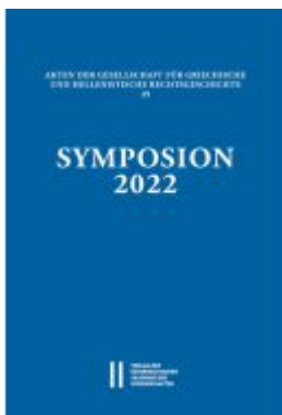
Symposium 2022 Ladenpreis: 120,00EUR

Wir haben andere Produkte gefunden, die Ihnen gefallen könnten!