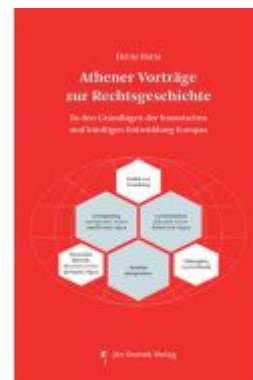
Athener Vorträge zur Rechtsgeschichte Ladenpreis: 29,90EUR