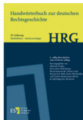
Handwörterbuch zur deutschen Rechtsgeschichte (HRG) – Lieferungsbezug - - - Lieferung 29: Rädelsführer-Rechtssoziologie Ladenpreis: 46,30EUR