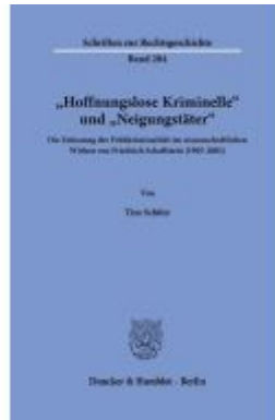
"Hoffnungslose Kriminelle" und "Neigungstäter". Ladenpreis: 92,50EUR