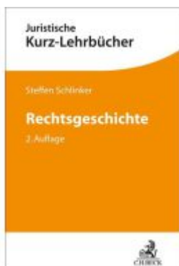
Rechtsgeschichte Ladenpreis: 33,90EUR