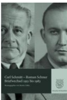
Briefwechsel 1951 bis 1983. Ladenpreis: 102,70EUR