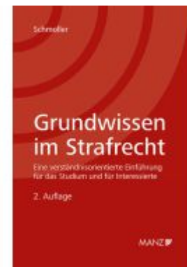
Grundwissen im Strafrecht Ladenpreis: 38,00EUR