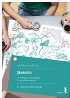
Statistik für Pflege- und andere Gesundheitsberufe Ladenpreis: 26,90EUR