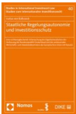
Staatliche Regelungsautonomie und Investitionsschutz Ladenpreis: 63,80EUR