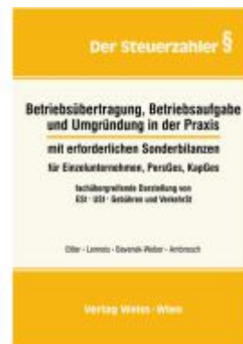
Betriebsübertragung, Betriebsaufgabe und Umgründung in der Praxis Ladenpreis: 82,50EUR