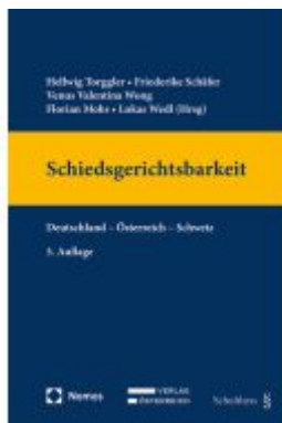
Schiedsgerichtsbarkeit Ladenpreis: 198,00EUR