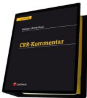
CRR-Kommentar Ladenpreis: 568,00EUR