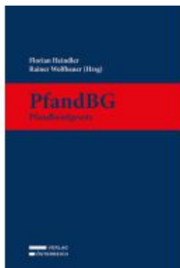
PfandBG - Pfandbriefgesetz Ladenpreis: 149,00EUR

Wir haben andere Produkte gefunden, die Ihnen gefallen könnten!