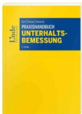
Praxishandbuch Unterhaltsbemessung Ladenpreis: 42,00EUR