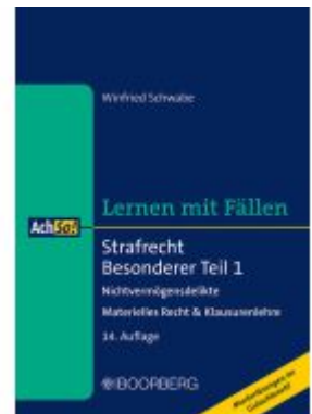
Strafrecht Besonderer Teil 1 Ladenpreis: 23,20EUR