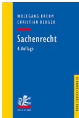
Sachenrecht Ladenpreis: 29,90EUR