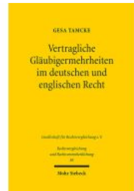
Vertragliche Gläubigermehrheiten im deutschen und englischen Recht Ladenpreis: 76,10EUR