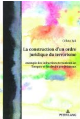
La construction d'un ordre juridique du terrorisme Ladenpreis: 123,40EUR