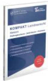
KOMPAKT Landesrecht - Hessen Ladenpreis: 24,60EUR