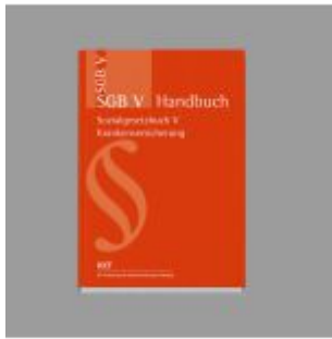
SGB V Handbuch Ladenpreis: 71,90EUR