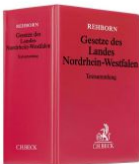
Gesetze des Landes Nordrhein-Westfalen Ladenpreis: 40,10EUR