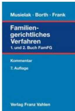
Familiengerichtliches Verfahren Ladenpreis: 128,50EUR

Wir haben andere Produkte gefunden, die Ihnen gefallen könnten!