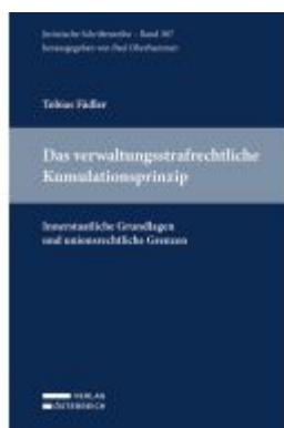
Das verwaltungsstrafrechtliche Kumulationsprinzip Ladenpreis: 59,00EUR