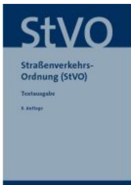
Straßenverkehrsordnung (StVO) Ladenpreis: 16,50EUR

Wir haben andere Produkte gefunden, die Ihnen gefallen könnten!