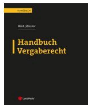
Handbuch Vergaberecht Ladenpreis: 265,00EUR