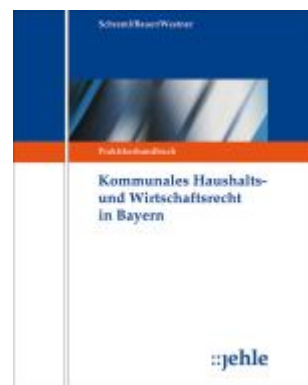
Kommunales Haushalts- und Wirtschaftsrecht in Bayern Ladenpreis: 552,10EUR