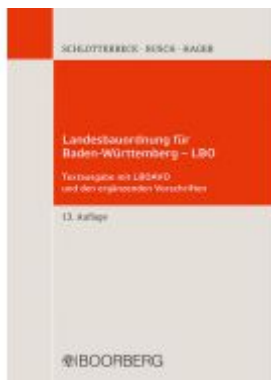
Landesbauordnung für Baden- Württemberg - LBO Ladenpreis: 20,40EUR