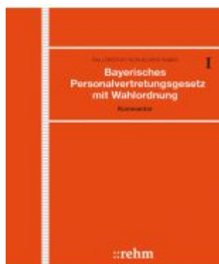
Bayerisches Personalvertretungsgesetz mit Wahlordnung Ladenpreis: 712,50EUR