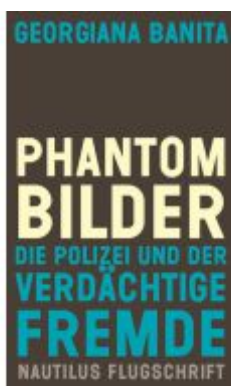
Phantombilder Ladenpreis: 24,70EUR