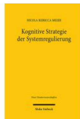
Kognitive Strategie der Systemregulierung Ladenpreis: 81,30EUR