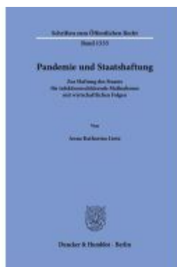
Pandemie und Staatshaftung Ladenpreis: 102,70EUR