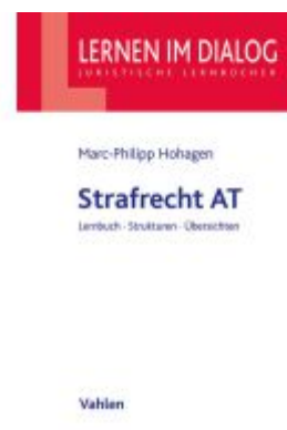
Strafrecht AT Ladenpreis: 27,70EUR