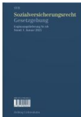
Sozialversicherungsrecht - Gesetzgebung EL 68 Ladenpreis: 62,00EUR