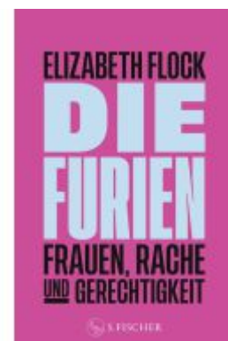
Die Furien – Frauen, Rache und Gerechtigkeit Ladenpreis: 28,80EUR