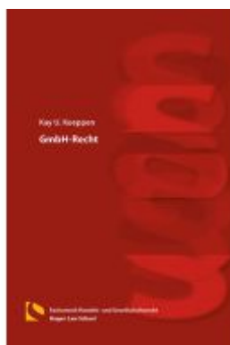
GmbH-Recht Ladenpreis: 25,70EUR