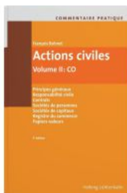
Commentaire pratique Actions civiles Ladenpreis: 240,00EUR