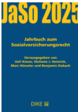
Jahrbuch zum Sozialversicherungsrecht 2025 Ladenpreis: 58,00EUR

Wir haben andere Produkte gefunden, die Ihnen gefallen könnten!