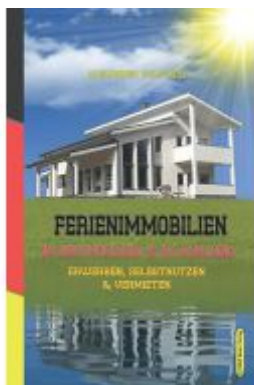
Ferienimmobilien in Deutschland & im Ausland Ladenpreis: 29,90EUR