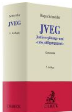
JVEG Ladenpreis: 128,50EUR