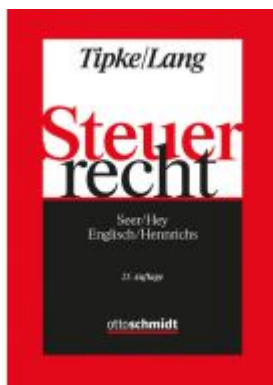
Steuerrecht Ladenpreis: 92,40EUR