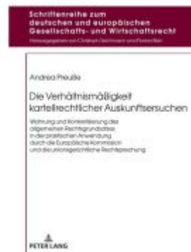
Die Verhältnismäßigkeit kartellrechtlicher Auskunftersuchen Ladenpreis: 68,80EUR