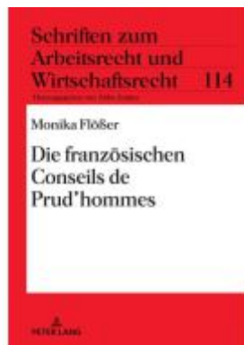
Die französischen Conseils de Prud'hommes Ladenpreis: 56,50EUR