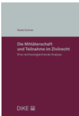
Die Mittäterschaft und Teilnahme im Zivilrecht Ladenpreis: 86,00EUR