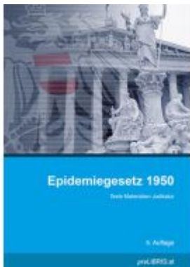
Epidemiegesetz 1950 Ladenpreis: 25,00EUR

Wir haben andere Produkte gefunden, die Ihnen gefallen könnten!