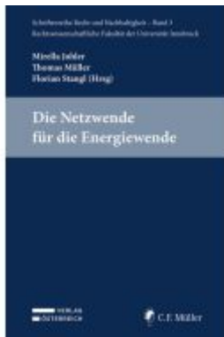
Die Netzwerke für die Energiewende Ladenpreis: 29,00EUR