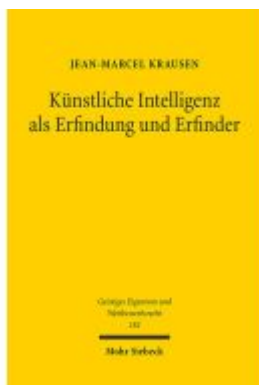
Künstliche Intelligenz als Erfindung und Erfinder Ladenpreis: 91,50EUR