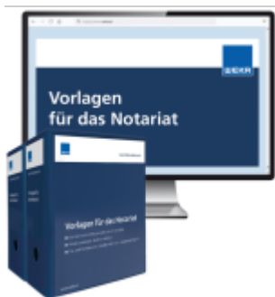
Vorlagen für das Notariat Ladenpreis: 261,80EUR

Wir haben andere Produkte gefunden, die Ihnen gefallen könnten!