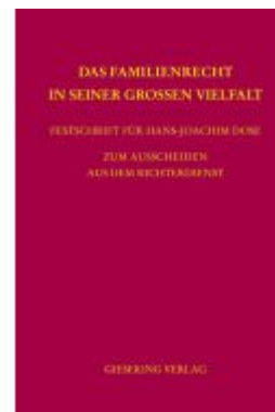
Das Familienrecht in seiner großen Vielfalt Ladenpreis: 153,20EUR