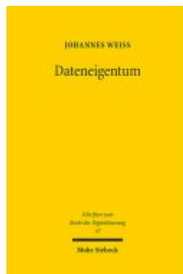
Dateneigentum Ladenpreis: 96,70EUR