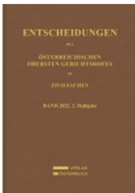
Entscheidungen des Obersten Gerichtshofes in Zivilsachen Ladenpreis: 174,00EUR