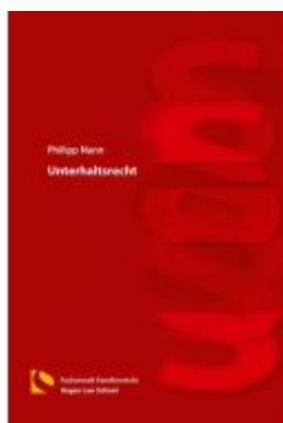
Unterhaltsrecht Ladenpreis: 46,30EUR