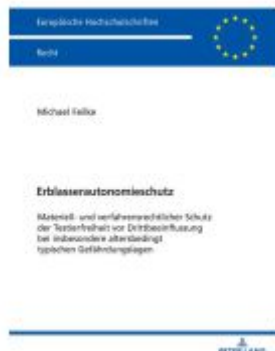
Erblasserautonomieschutz Ladenpreis: 71,90EUR