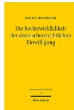
Die Rechtswirklichkeit der datenschutzrechtlichen Einwilligung Ladenpreis: 86,40EUR