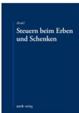
Steuern beim Erben und Schenken Ladenpreis: 60,70EUR