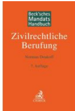
Beck'sches Mandatshandbuch Zivilrechtliche Berufung Ladenpreis: 132,70EUR