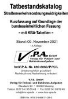
Grundwerk - Kurzfassung auf Grundlage der bundeseinh. Fassung mit KBA- Tabellen, Loseblatt-Ausgabe Ladenpreis: 35,80EUR