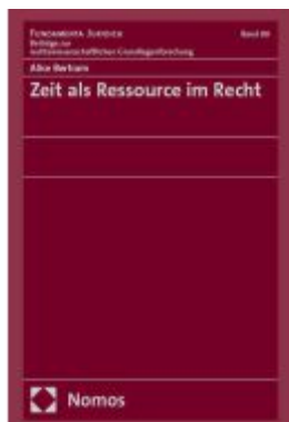
Zeit als Ressource im Recht Ladenpreis: 117,20EUR