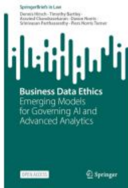
Business Data Ethics Ladenpreis: 32,99EUR