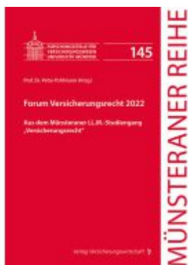
Forum Versicherungsrecht 2022 Ladenpreis: 66,70EUR