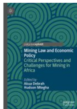
Mining Law and Economic Policy Ladenpreis: 49,49EUR