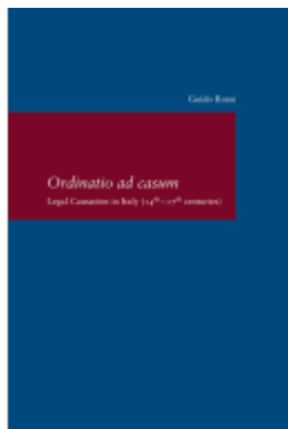
Ordinatio ad Casum Ladenpreis: 91,50EUR