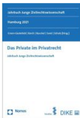
Das Private im Privatrecht Ladenpreis: 79,00EUR