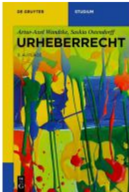
Urheberrecht Ladenpreis: 34,95EUR