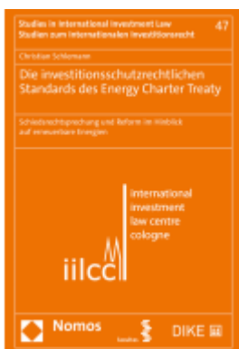
Die investitionsschutzrechtlichen Standards des Energy Charter Treaty Ladenpreis: 129,00EUR