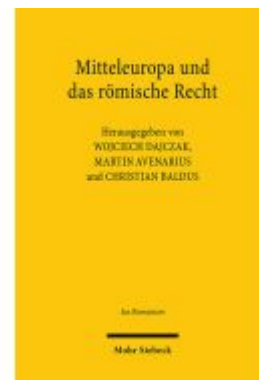
Mitteleuropa und das römische Recht Ladenpreis: 86,40EUR