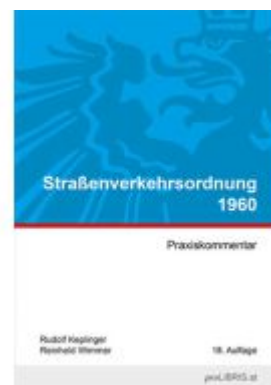
Straßenverkehrsordnung 1960 Ladenpreis: 26,00EUR