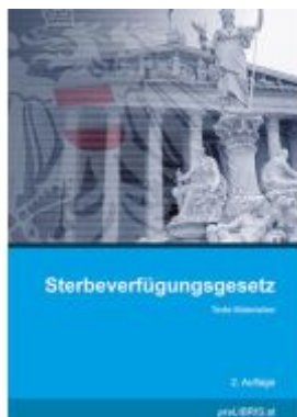
Sterbeverfügungsgesetz Ladenpreis: 13,00EUR