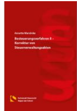
Besteuerungsverfahren II – Korrektur von Steuerverwaltungsakten Ladenpreis: 19,50EUR