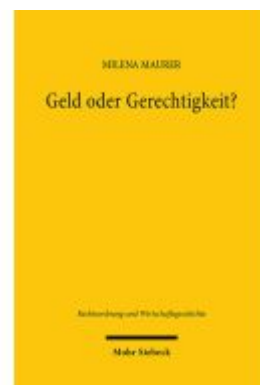
Geld oder Gerechtigkeit? Ladenpreis: 87,40EUR