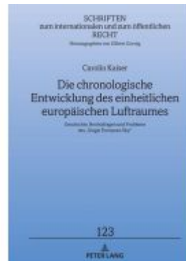
Die chronologische Entwicklung des einheitlichen europäischen Luftraumes Ladenpreis: 97,60EUR