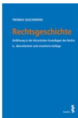
Rechtsgeschichte Ladenpreis: 49,00EUR