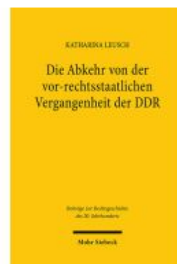
Die Abkehr von der vor-rechtsstaatlichen Vergangenheit der DDR Ladenpreis: 91,50EUR