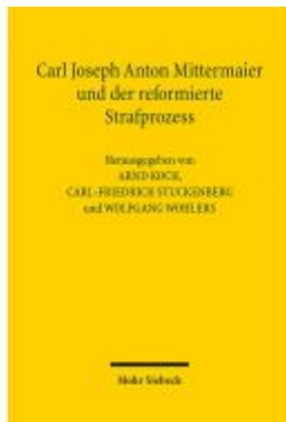
Carl Joseph Anton Mittermaier und der reformierte Strafprozess Ladenpreis: 107,00EUR