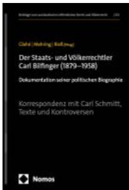
Der Staats- und Völkerrechtler Carl Bilfinger (1879–1958) Ladenpreis: 158,40EUR