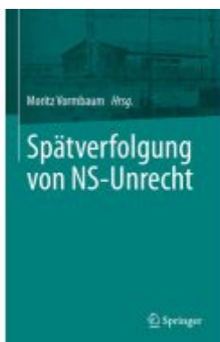
Spätverfolgung von NS-Unrecht Ladenpreis: 154,20EUR