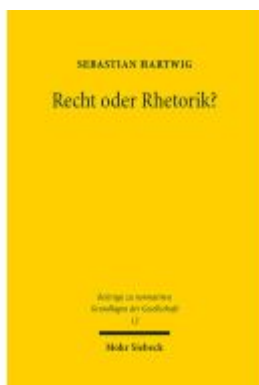
Recht oder Rhetorik? Ladenpreis: 127,50EUR