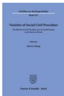
Varieties of Social Civil Procedure Ladenpreis: 71,90EUR