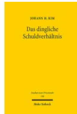
Das dingliche Schuldverhältnis Ladenpreis: 81,30EUR