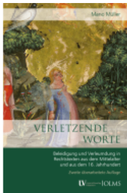
Verletzende Worte Ladenpreis: 59,70EUR