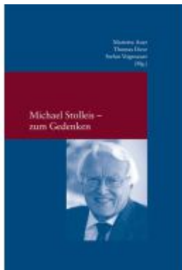
Michael Stolleis – zum Gedenken Ladenpreis: 22,70EUR

Wir haben andere Produkte gefunden, die Ihnen gefallen könnten!