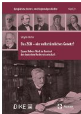
Das ZGB – ein volkstümliches Gesetz? Ladenpreis: 99,80EUR