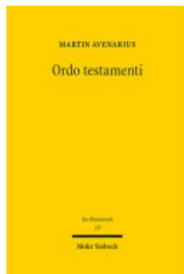
Ordo testamenti Ladenpreis: 137,80EUR