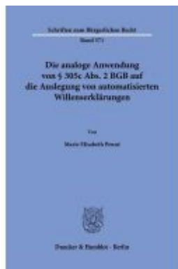
Die analoge Anwendung von § 305c Abs. 2 BGB auf die Auslegung von automatisierten Willenserklärungen. Ladenpreis: 71,90EUR