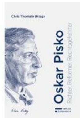
Oskar Pisko - Richter, Reformier, Rechtsgelehrter Ladenpreis: 99,00EUR