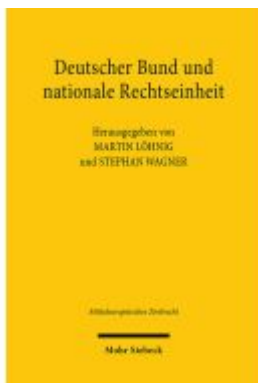
Deutscher Bund und nationale Rechtseinheit Ladenpreis: 91,50EUR