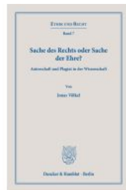
Sache des Rechts oder Sache der Ehre? Ladenpreis: 71,90EUR