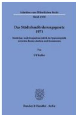
Das Städtebauförderungsgesetz 1971. Ladenpreis: 113,00EUR