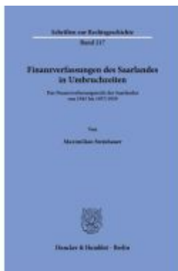
Finanzverfassungen des Saarlandes in Umbruchzeiten. Ladenpreis: 92,50EUR