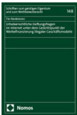
Urheberrechtliche Haftungsfragen im Internet unter dem Gesichtspunkt der Werbefinanzierung illegaler Geschäftsmodelle Ladenpreis: 132,70EUR