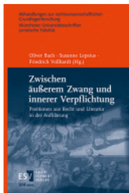
Zwischen äußerem Zwang und innerer Verpflichtung Ladenpreis: 92,50EUR