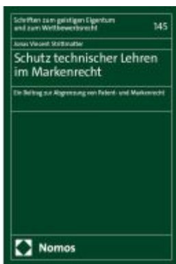
Schutz technischer Lehren im Markenrecht Ladenpreis: 132,70EUR