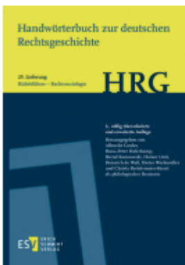
Handwörterbuch zur deutschen Rechtsgeschichte (HRG) – Lieferungsbezug – - - Lieferung 29: Rädelsführer-Rechtssoziologie Ladenpreis: 46,30EUR