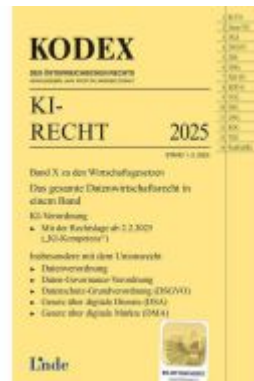
KODEX KI-Recht Ladenpreis: 24,00EUR