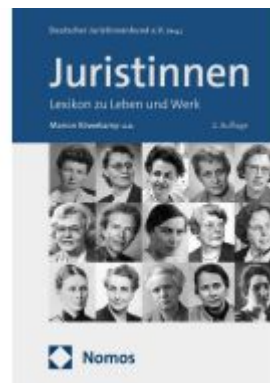
Juristinnen Ladenpreis: 101,80EUR