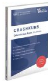
CRASHKURS Öffentliches Recht - Sachsen Ladenpreis: 27,70EUR