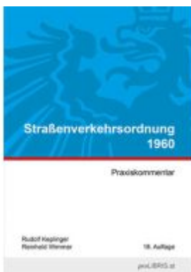
Straßenverkehrsordnung 1960 Ladenpreis: 26,00EUR