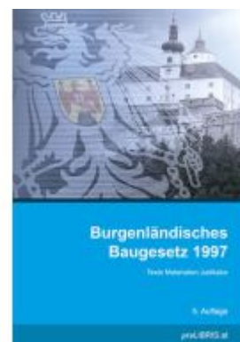
Burgenländisches Baugesetz 1997 Ladenpreis: 23,00EUR