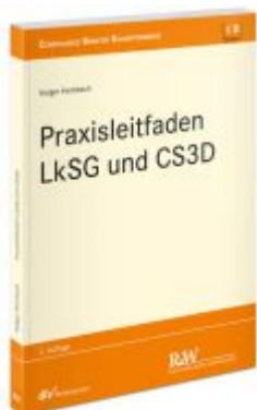
Praxisleitfaden LkSG und CS3D Ladenpreis: 91,50EUR

Wir haben andere Produkte gefunden, die Ihnen gefallen könnten!