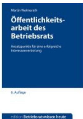
Öffentlichkeitsarbeit des Betriebsrats Ladenpreis: 11,30EUR