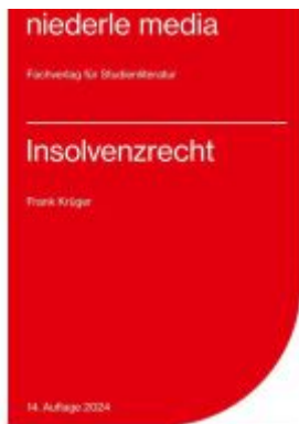
Insolvenzrecht - 2024 Ladenpreis: 17,40EUR