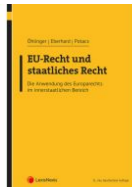
EU-Recht und staatliches Recht Ladenpreis: 54,00EUR