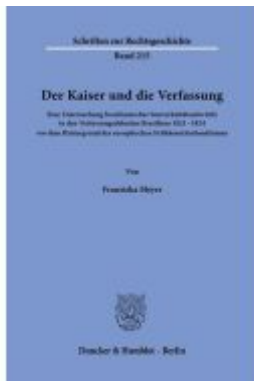
Der Kaiser und die Verfassung. Ladenpreis: 92,50EUR