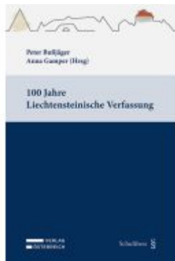
100 Jahre Liechtensteinische Verfassung Ladenpreis: 49,00EUR