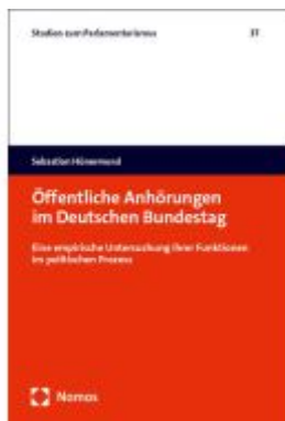
Öffentliche Anhörungen im Deutschen Bundestag Ladenpreis: 107,00EUR