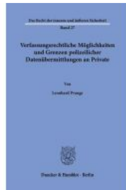
Verfassungsrechtliche Möglichkeiten und Grenzen polizeilicher Datenübermittlungen an Private. Ladenpreis: 92,50EUR