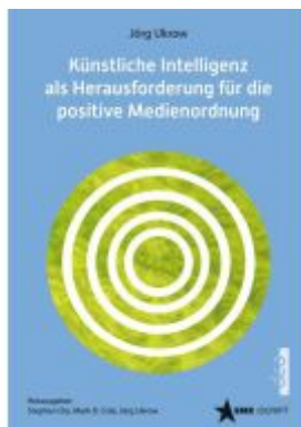
Künstliche Intelligenz (KI) als Herausforderung für die positive Medienordnung