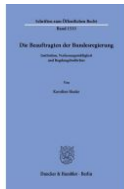
Die Beauftragten der Bundesregierung