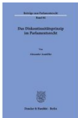
Das Diskontinuitätsprinzip im Parlamentsrecht. Ladenpreis: 92,50EUR