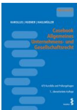
Casebook Allgemeines Unternehmens- und Gesellschaftsrecht Ladenpreis: 40,00EUR