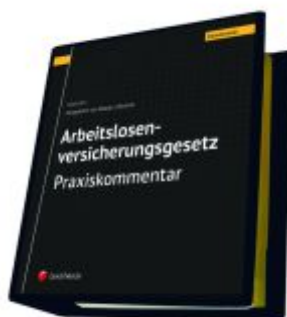
Arbeitslosenversicherungsgesetz - Praxiskommentar Ladenpreis: 290,00EUR