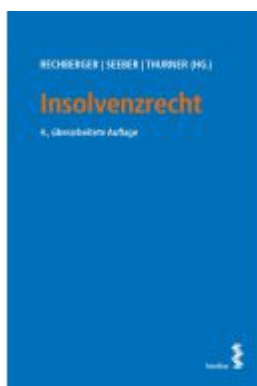
Insolvenzrecht Ladenpreis: 36,00EUR