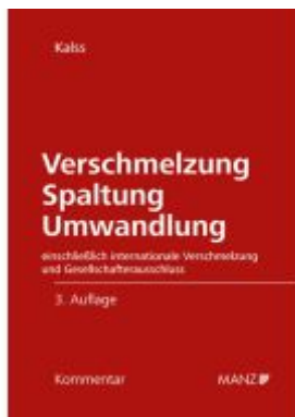
Verschmelzung Spaltung Umwandlung Ladenpreis: 298,00EUR