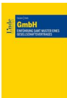
GmbH Ladenpreis: 49,00EUR