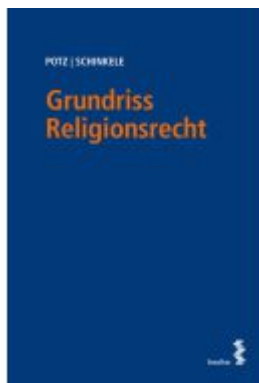
Grundriss Religionsrecht Ladenpreis: 78,00EUR

Wir haben andere Produkte gefunden, die Ihnen gefallen könnten!