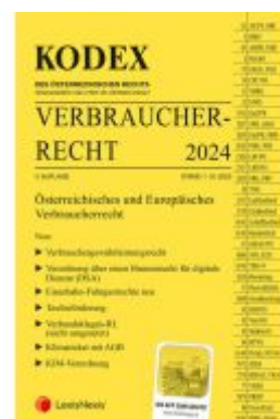
KODEX Verbraucherrecht 2024 Ladenpreis: 45,00EUR