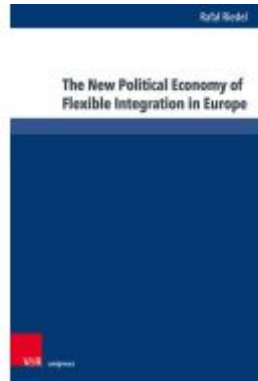
The New Political Economy of Flexible Integration in Europe Ladenpreis: 52,00EUR