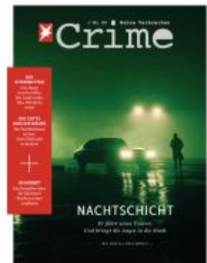
stern Crime - Wahre Verbrechen Ladenpreis: 7,10EUR