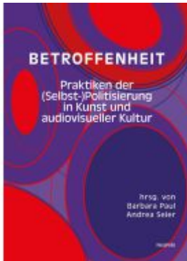
Betroffenheit Ladenpreis: 19,60EUR