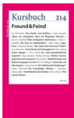
Kursbuch 214 Ladenpreis: 16,40EUR