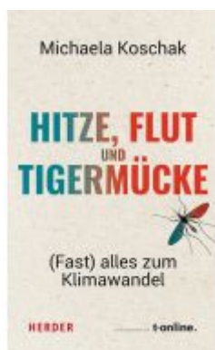
Hitze, Flut und Tigermücke Ladenpreis: 20,60EUR