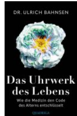
Das Uhrwerk des Lebens Ladenpreis: 24,70EUR