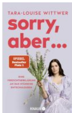
Sorry, aber ... Ladenpreis: 18,50EUR