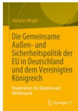
Die Gemeinsame Außen- und Sicherheitspolitik der EU in Deutschland und dem Vereinigten Königreich Ladenpreis: 66,81EUR