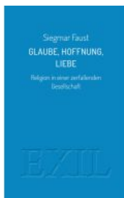
Glaube, Hoffnung, Liebe Ladenpreis: 19,60EUR